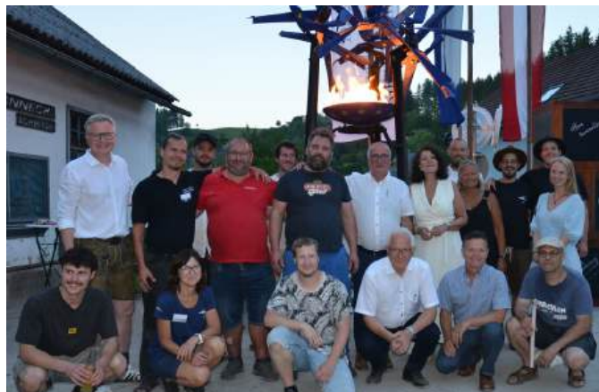
Erstmals erfolgreich durchgeführt unter der Federführung des Vereins Schmiedezentrum von 19. - 21. Juni 2026.