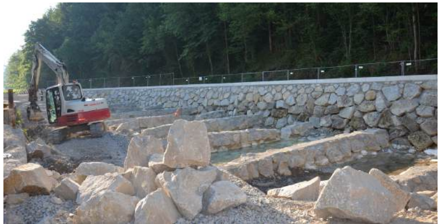
Derzeit werden die Arbeiten im Flussbett für den Fischaufstieg durchgeführt.

Zügig schreitet auch die Umsetzung der Baumaßnahmen beim Hochwasserschutzprojekt in der Grestner Straße im Bereich „SASO“ voran. Die Fischaufstiegshilfe wurde bereits installiert und am Neubau der Brücke zur Liegenschaft Hönickl wird derzeit gerade gearbeitet. Die Fertigstellung des Projektes ist für Herbst 2026 geplant.