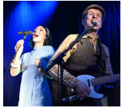
THE SOLOMONS begeisterten mit ihrem Konzertabend mit Musikleidenschaft, Freude und Energie bei Fa. Aigner.Boden.Räume