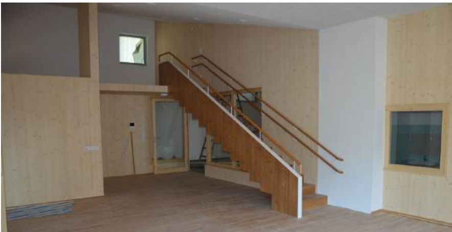
Die Kindergartenbaustelle in der Alten Poststraße ist in der finalen Phase und einem Betrieb ab September steht nichts mehr im Wege.

Die Arbeiten für die Fertigstellung des NÖ Landeskindergartens I schreiten zügig voran und eine Inbetriebnahme ab Herbst 2026 kann erfolgen. In den nächsten Wochen erfolgt die Möblierung und Einrichtung der neuen Gruppenräume. Geplante Eröffnungsfeier: Freitag, 09. Oktober 2026, 10.00 Uhr durch Landesrätin Mag. Christiane Teschl-Hofmeister