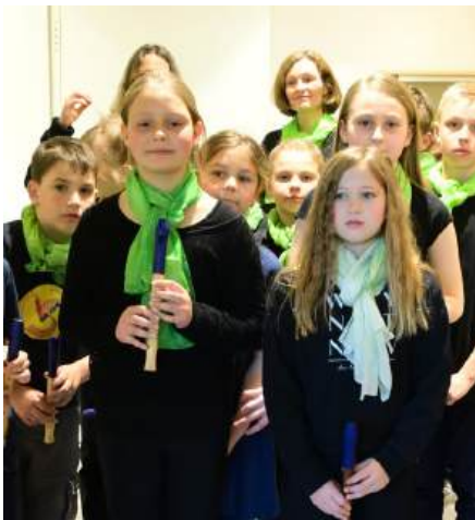
Das Familienkonzert DER HOFFNUNGSVOGEL - beeindruckte durch fröhliches musikalisches & kreatives Miteinander im Turnsaal der Mittelschule.