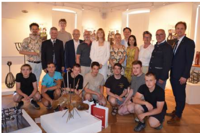
Ausstellung „SCHMIEDEN VERBINDET“ - zu 25 Jahre Zusammenarbeit Schule Brünn (CZ); 19. Juni - 6. September 2026 im FeRRUM.