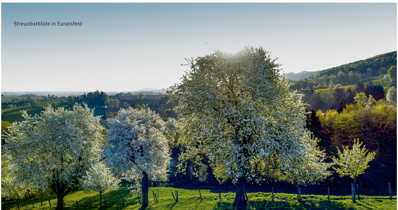
Streuoobstblüte in Euratsfeld

Die Klimawandelanpassungsmodellregion (KLAR!) Amstetten unterstützt Gemeinden und Regionen dabei, sich auf diese Veränderungen einzustellen und resilienter gegenüber den Herausforderungen des Klimawandels zu werden.