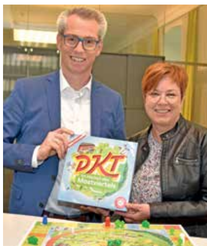
Ein Spiel für die ganze Familie - die Sonderedition ist am Gemeindeamt erhältlich.

Im Mittelpunkt stehen die regionalen Besonderheiten, Betriebe sowie insbesondere die 31 Gemeinden der Region Moststraße. Spielerinnen und