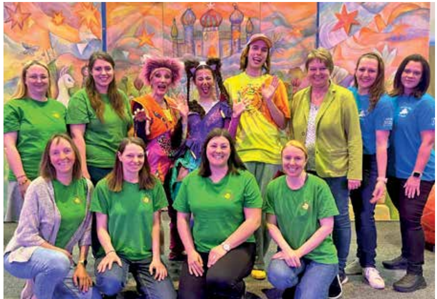
Gemeinsam bereiteten die Darsteller, das EKIZ-Team, das Familienreferat sowie der Elternverein den Kindern und Familien einen vergnüglichen Nachmittag.

Dieses Betretungs- bzw. Befahrungsrecht wird selbstverständlich mit größtmöglicher Sorgfalt ausgeübt und darauf geachtet, Beeinträchtigungen der Ausübung von Rechten an den Grundstücken soweit wie möglich zu vermeiden.