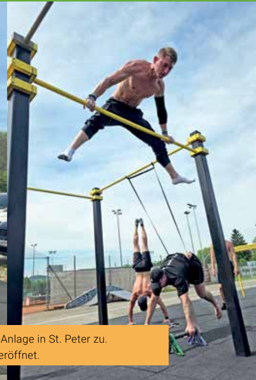
Sportlich ging es am Muttertag beim Soft-Opening des Calisthenics-Parks sowie der Beachvolleyball-Anlage in St. Peter zu. Gemeinsam wurde für den guten Zweck gelaufen und die revitalisierten Sportanlagen der Gemeinde eröffnet.