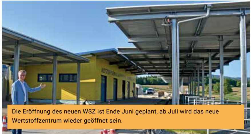
Die Eröffnung des neuen WSZ ist Ende Juni geplant, ab Juli wird das neue Wertstoffzentrum wieder geöffnet sein.

Die Abfallwirtschaft hat sich in den vergangenen Jahrzehnten stark verändert: Während in den 1980er-Jahren noch vergleichsweise wenige Abfallarten ge-