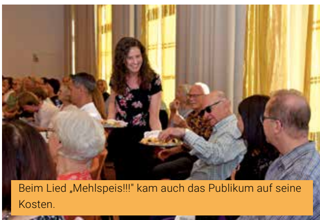
Beim Lied „Mehlspeis´!!!“ kam auch das Publikum auf seine Kosten.