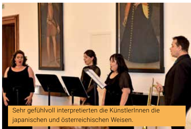
Sehr gefühlvoll interpretierten die KünstlerInnen die japanischen und österreichischen Weisen.

Mit den Zugaben „Jung san ma! Fesch san ma!“ und „Heut kommen D´Engerl auf Urlaub noch Wear“ wurde das begeisterte Publikum nicht nur zum Zuhören, sondern auch zum Mitmachen eingeladen, was dem Konzert eine besonders herzliche Atmosphäre verlieh, und für beste Stimmung sorgte.