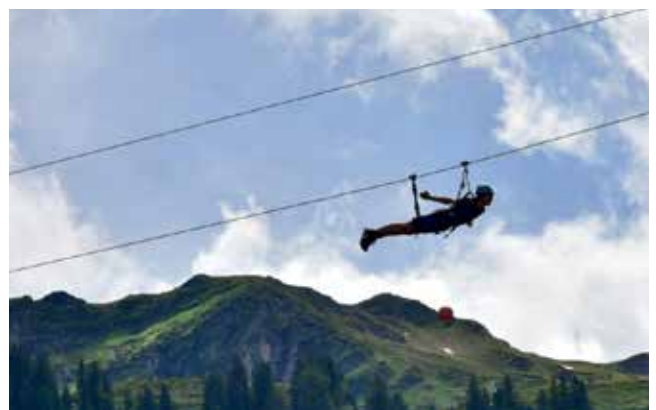
Actionreiche und abwechslungsreiche Tage verbrachten die Schüler der PTS St. Peter/Au in Hinterglemm.