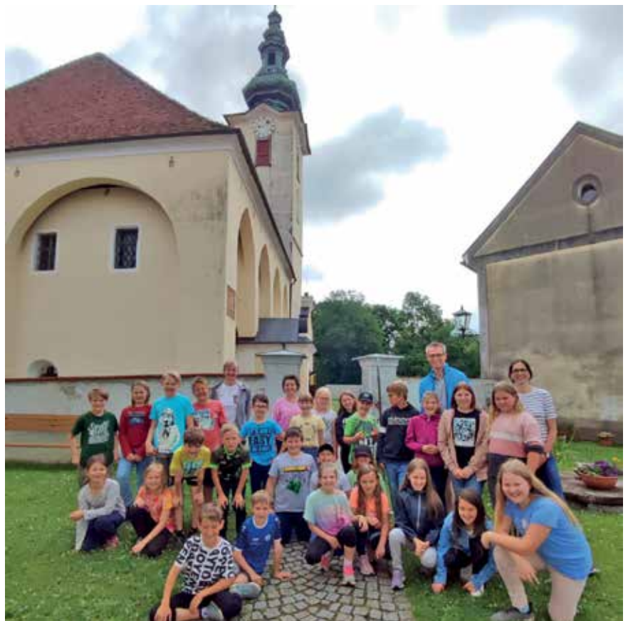
Die Schüler aus Kürnberg und St. Johann tourten gemeinsam mit dem Bürgermeister durch die Gemeinde und hatten viel Spaß dabei.

ven Tag, bei dem auch der Spaß nicht zu kurz kam.