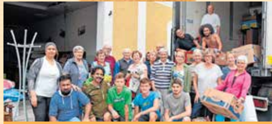
Am 2. September wird beim Feuerwehrhaus für Bedürftige gesammelt. Auch Helfer sind willkommen!