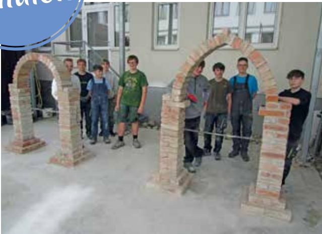
Mit Bravour meisterten die Schüler des Fachbereichs Bau die Abschlussarbeit - einen Rund- und einen Spitzbogen.