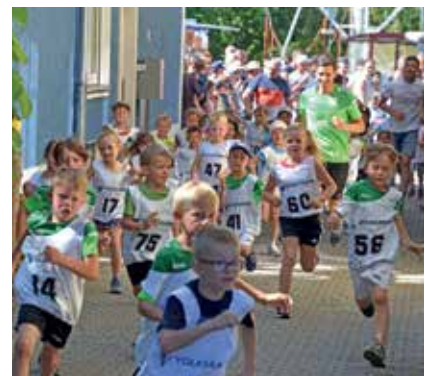
Auch die jüngsten Teilnehmer waren beim Meilenlauf top-motiviert.