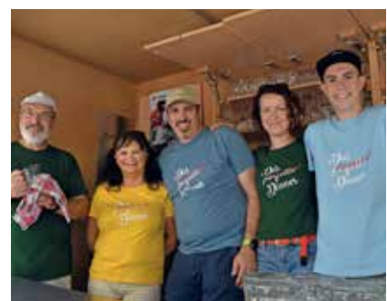
Die Vereine, im Bild die Theatergruppe St. Peter/Au, und die Gastronomie sorgten für das Wohl der Besucher.