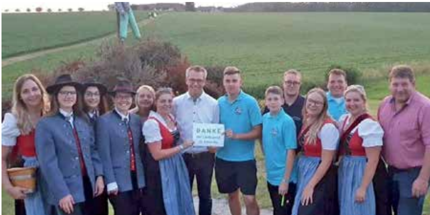
Mit dem Peterfeuer, das von der Landjugend bereitgestellt wurde, und dem großen Feuerwerk wurde das Kirtagswochenende gestartet.