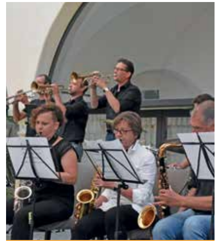
Stimmung pur versprühte die Lehrerband der Musikschule.