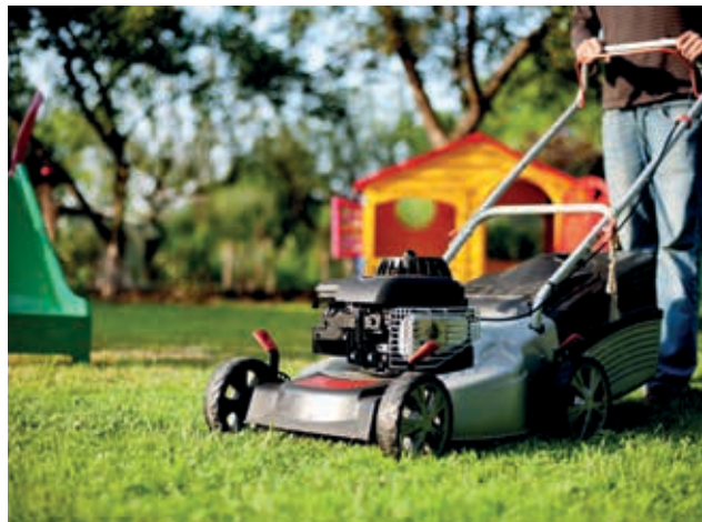
Aus Rücksicht auf unsere Mitmenschen sollten laute Arbeiten, wie z.B. Rasenmähen, laute Musik sowie das Ausbringen von Gülle an Feiertagen und am Wochenende vermieden werden.

Jede/r Gartenbesitzer/in liebt den eigenen Garten und möchte sich auch am Wochenende oder Abend im gepflegten Garten erholen. Aus Rücksicht auf seine Mitmenschen sollten laute Arbeiten und insbesondere Rasenmähen zu Mittag bzw. an Feiertagen und am Wochenende (Samstag ab 14 Uhr) vermieden werden. Bitte beachten Sie, dass möglicherweise auch Ihre auf der Terrasse laut aufgedrehte Lieblingsmusik nicht unbedingt