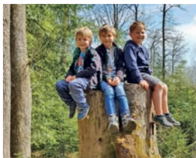
Die Volksschüler haben im Wald tolle Eindrücke gesammelt.

In der letzten Schulwoche werden sich auch die Schüler der VS Kürnberg mit Anja auf den Weg machen.