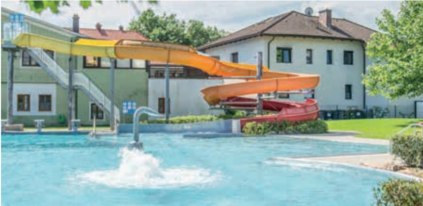
Das St. Peterer Familien-Erlebnisbad bietet in den Sommermonaten wieder ein Badevergnügen für alle Generationen.

Das Freibad hat wieder geöffnet und bietet Badespaß vom Feinsten für die ganze Familie! Allerdings ist der Zutritt beschränkt und es gilt, die Covid-19-Verhaltensregeln einzuhalten!