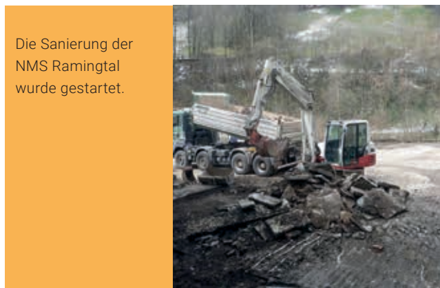
Die Sanierung der NMS Ramingtal wurde gestartet.