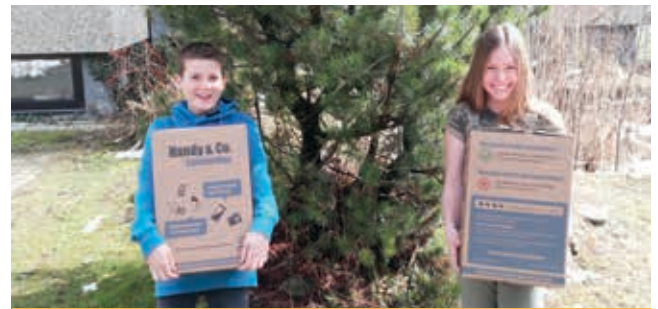
Die Schülerinnen und Schüler sammeln Handys für die Aktion des Jane Goodall-Institutes Austria zur Rettung von Schimpansen in Afrika.