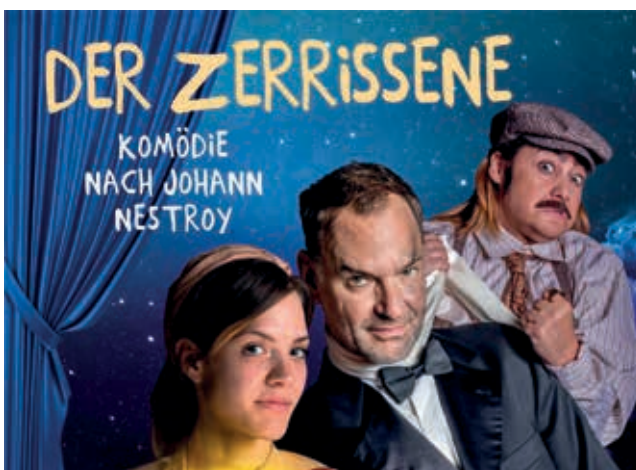
Ermäßigte Karten für den St. Peterer Tag am 10. Juli können Bürgerinnen und Bürger unter der Telefonnummer 07434/44600 bestellen. Achtung, begrenzte Plätze!

Für Personen, die in einem gemeinsamen Haushalt leben, gelten untereinander die Abstandsregeln nicht. (Stand 31. Mai 2021)