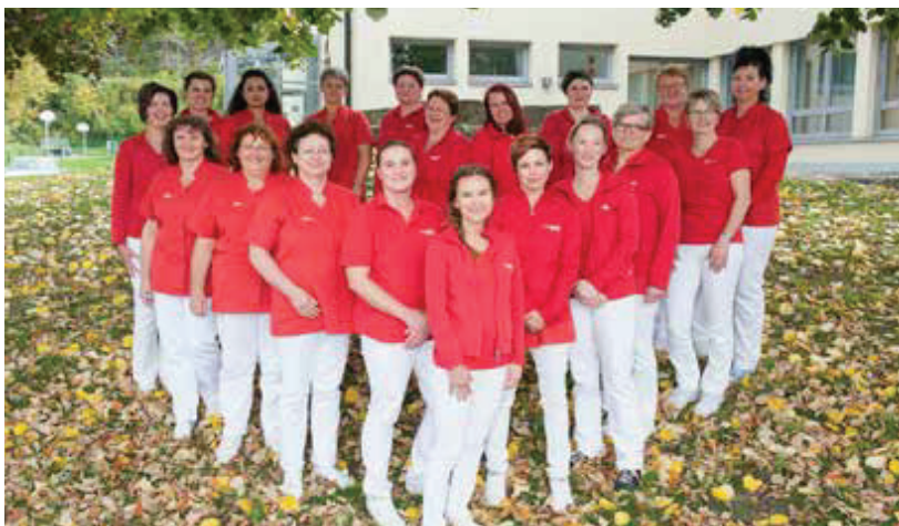
Das Team der Caritas Sozialstation Sankt Severin

Wenn Sie Informationen oder Hilfe brauchen, wenden Sie sich bitte an die Caritas Sozialstation Sankt Severin!