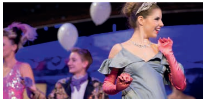
Maske in Blau – ein Operette von Fred Raymond

Sie können bereits jetzt Karten für die gewünschte Kategorie am Gemeindeamt St. Georgen/Y. (07473/2312) reservieren und vor Ort bezahlen. Anfang Oktober können die Karten dann am Gemeindeamt abgeholt werden.