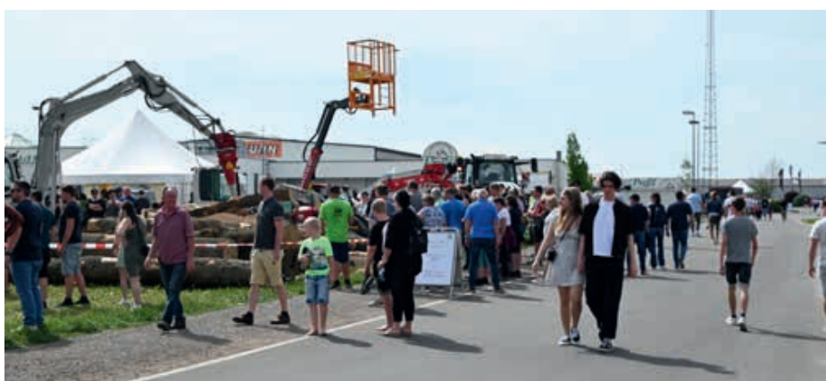
Zahlreiche Angebote lockten die Besucher in die Gewerbestraße.