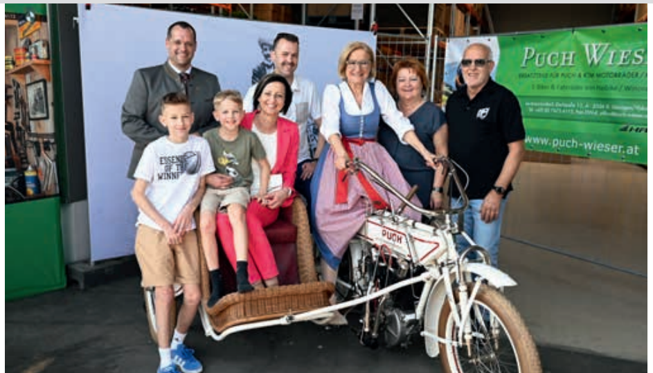
Landeshauptfrau Johanna Mikl-Leitner erkundete bei einem Rundgang das Gewerbegebiet.