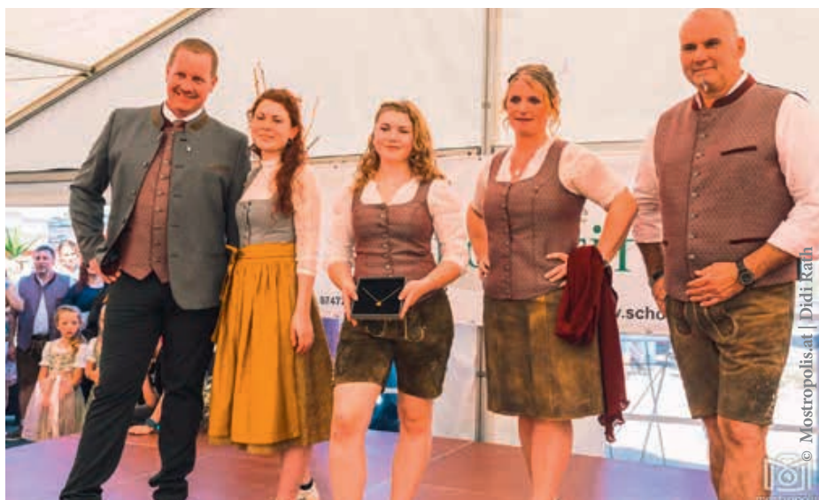
Bei einer Modenschau wurde die St. Georgner Tracht gemeinsam mit der Mostviertler Lederhosen und der Schmuckkollektion „Most Beautiful“ präsentiert.