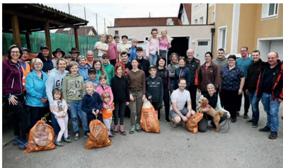
Ausgerüstet mit Greifzangen, Handschuhen und Müllsäcken, waren die großen und kleinen Helfer im Gemeindegebiet unterwegs.