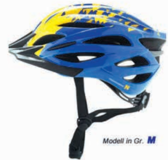
Modell in Gr. M

Um ihre Köpfe zu schützen und vor schweren Unfällen zu bewahren, gibt es vom Land Niederösterreich eine Helmeaktion. Im Rahmen dieser Aktion können die Helme unter www.achtung.at/shop/ zum geförderten Aktionspreis (50 % geförderter NÖ Radhelm kostet inkl. Steuer € 9,50 anstatt ohne Förderung € 19,08) bestellt werden. Die Helme sind nur an Adressen in Niederösterreich lieferbar.