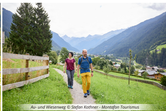
Au- und Wiesenweg