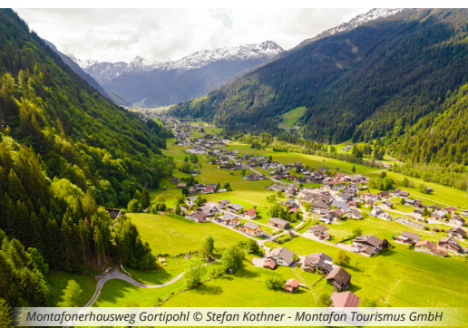
Montafonerhausweg Gortipohl