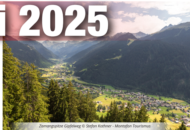
Zamangspitze Gipfelweg