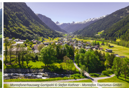
Montafonerhausweg Gortipohl