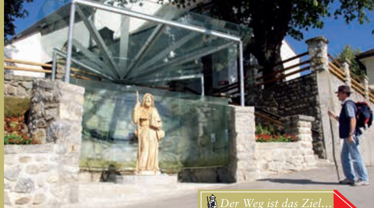
Einstiegsstelle bei der Pfarrkirche

Öffnungszeiten: Sa: Nachmittag, Sonn- und Feiertag: ganztags. Für Gruppen gegen Anmeldung auch außerhalb der Öffnungszeiten.