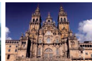
Santiago de Compostela

Bei 13 Stationen erfährt man auf dieser kleinen Pilgertour Wissenswertes über den Jakobsweg: Eine genaue Etappenbeschreibung, ausgehend von der österreichischen Grenze bei Hainburg bis zum Endpunkt in Santiago de Compostela an der spanischen Atlantikküste; dazu Interessantes über Pilgern einst und jetzt, Sinnsprüche über Lebensweisheiten sowie Erfahrungsberichte und Gedanken von Pilgern.