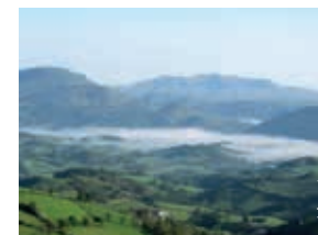
Ausblick von den Pyrenäen