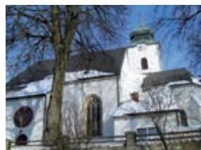
Jakobskirche in Neustadtl