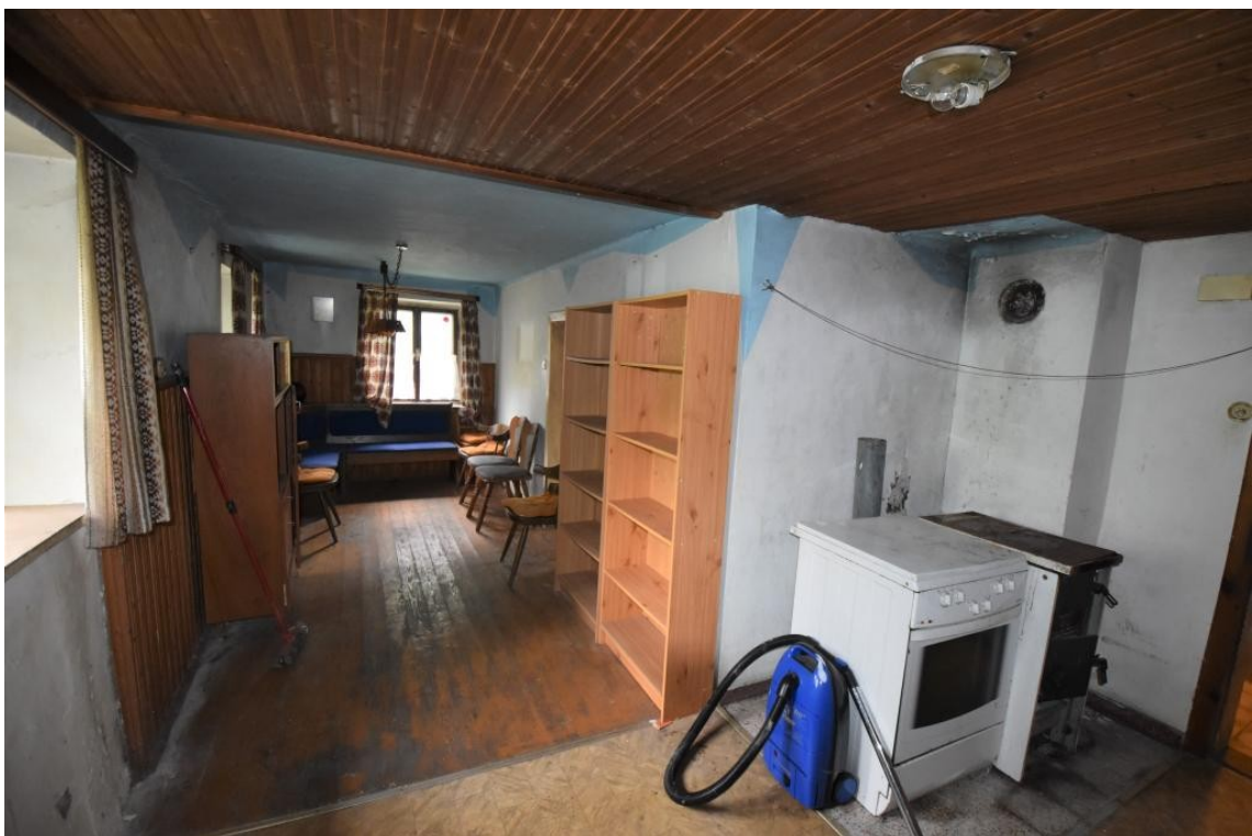
Küche / Wohnzimmer EG