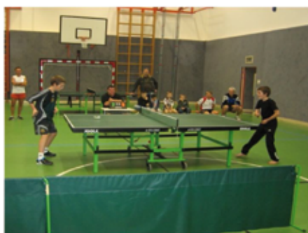
Sport frei! Das Askö Ennsdorf TT-Team

Auf eine zahlreiche Teilnahme freut sich der Askö Ennsdorf.