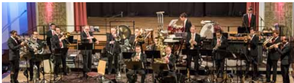
Bild: Pro Brass.