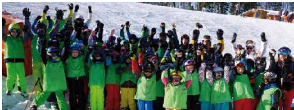
Bild: Die Schikurs-Teilnehmer hatten großen Spaß.

Am 4. Februar 2017 fand ein Schitag für Kinder ab 8 Jahren und Jugendlichen bis 14 Jahre statt.