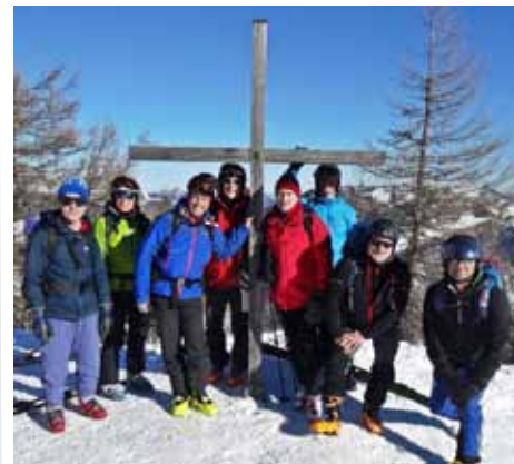
Bild: Die 8 Teilnehmer am Schafkogel.

Vom Langlaufzentrum Innerrosenau auf den Hochsur, wie der Gipfel von den Einheimischen bezeichnet wird, machte den Genuss- und sportlichen Tourengern mit etwa 700 Höhenmetern Aufstieg und tiefwinterlicher Pulverschneeabfahrt gleichermaßen Vergnügen.