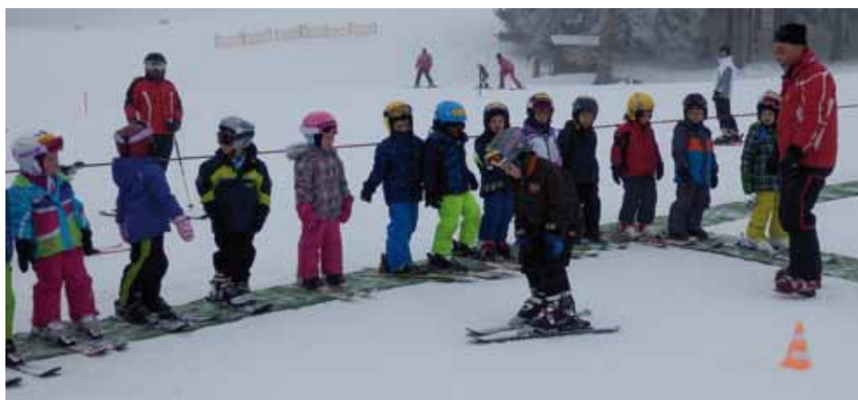
Bild: Die Kinderschikurs-Teilnehmer bei der Einschulung.

Die Kinder, die großteils zum ersten Mal auf den Skiern gestan-