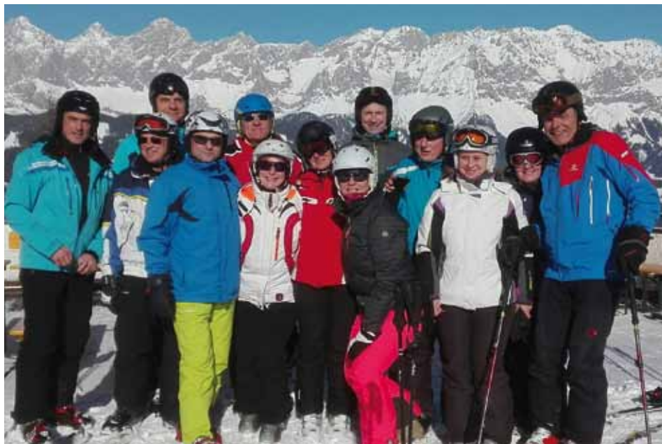
Bild: Die Schifahrer aus Windpassing.

So konnten die Busse am Abend wieder planmäßig Richtung Heimat abfahren.