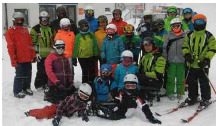
Bild: Schikurs-Teilnehmer auf der Wurzeralm.

In den Weihnachtsferien wurde ein Skikurs für fortgeschrittene Kinder auf der Wurzeralm abgehalten. 35 Kinder im Alter zwischen 8 und 12 Jahren perfektionierten hier in 4 Tagen ihre Skitechnik.