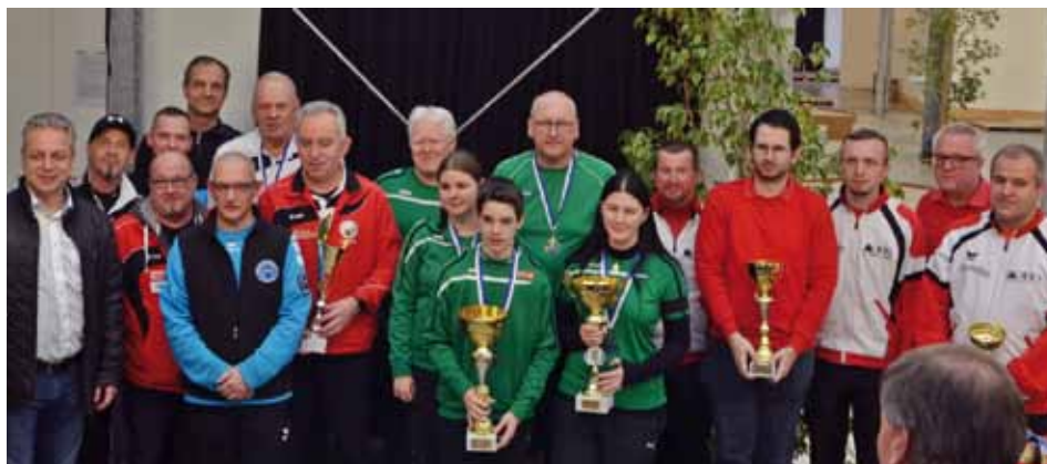
Bild: Die Siegerehrung.