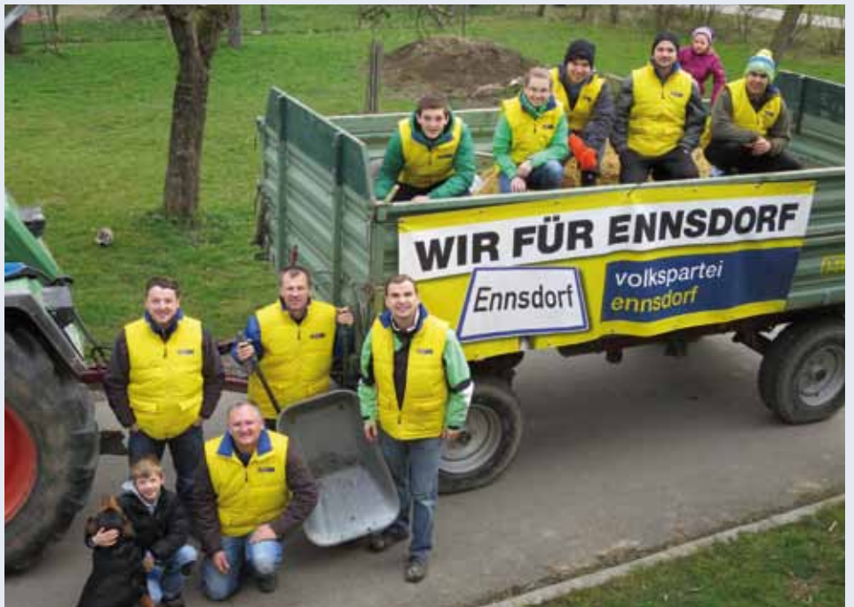
Bild: Die Volkspartei bei der Sandkastenbefüllung

Um einen reibungslosen Ablauf der Aktion zu gewährleisten, ersuchen wir bis spätestens Dienstag, 21. März 2017 , ihren Bedarf anzumelden.