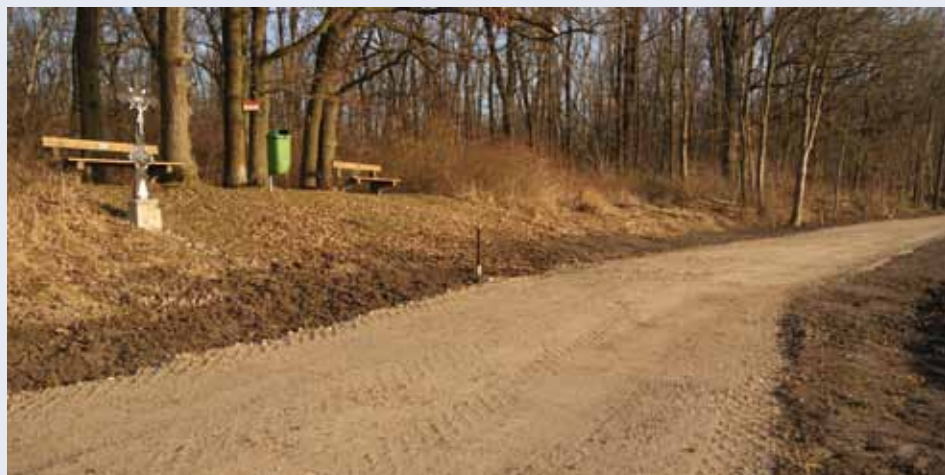
Bilder oben: Sanierung des Güterweges entlang des Waldrandes in Windpassing.