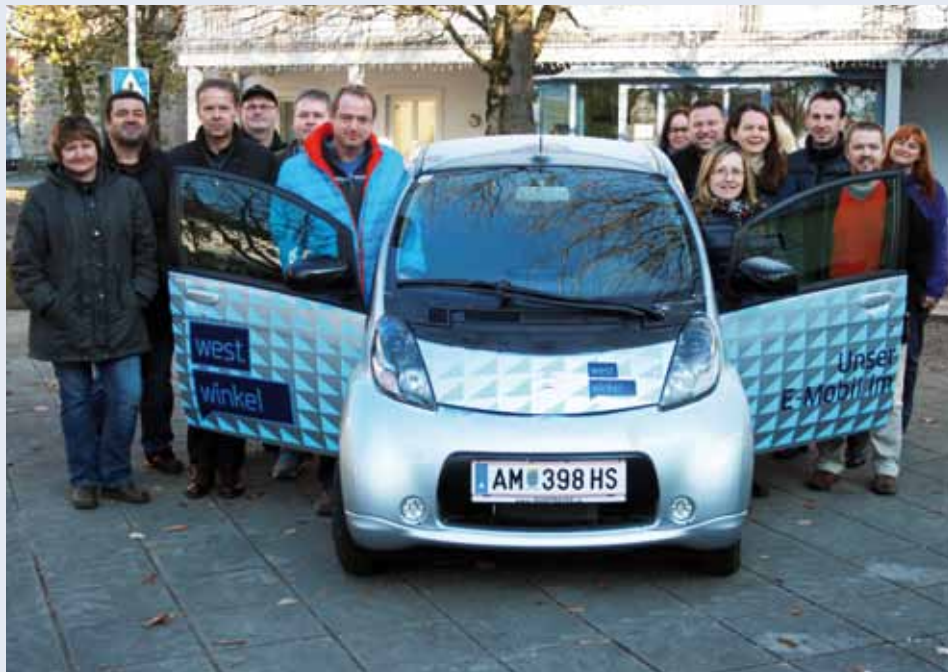
Bild: Die Westwinkelgemeinden präsentieren stolz ihr E-Fahrzeug Citroen Zero.

Alle Interessierten können sich am Gemeindeamt anmelden, um dieses Auto zu testen. Weiters wird das E-Auto als Dienstfahrzeug eingesetzt werden.