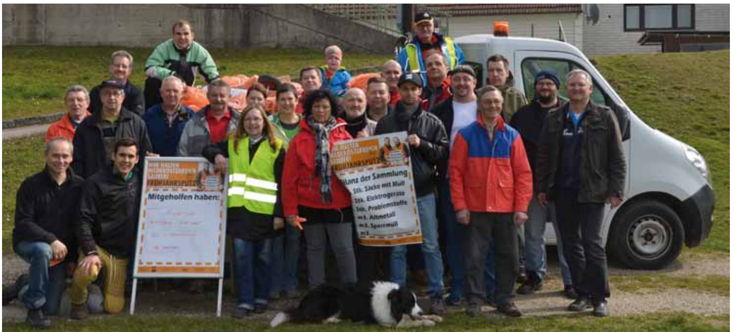
Bild: Die erfolgreiche Flurreinigungsaktion 2016.

Die Gemeinde Ennsdorf freut sich auf viele helfende Hände!