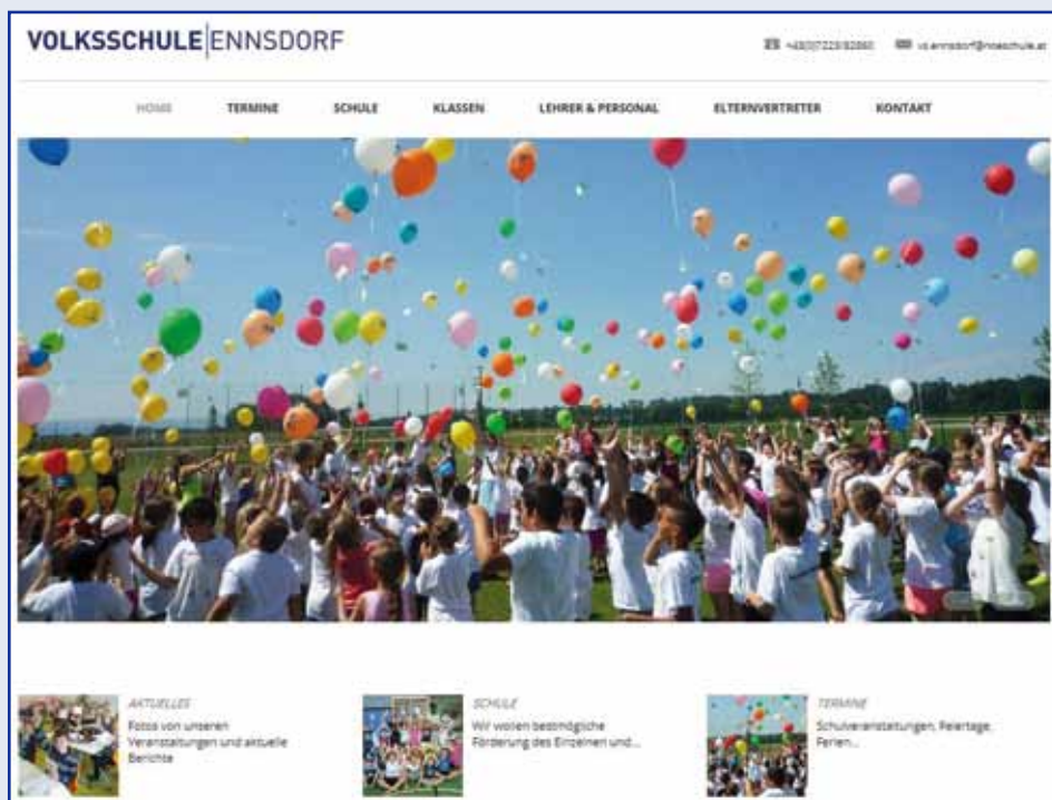
Bild: Startseite der neuen Homepage.

bietet einen Überblick über aktuelle Projekte und Termine in der Volksschule. Statten Sie der Volksschule einen virtuellen Besuch ab!