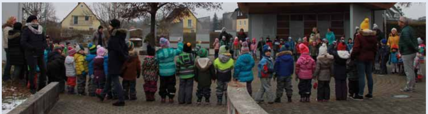
Bild: Kindergartenkinder überraschten Bürgermeister Alfred Buchberger und die Gemeindebediensteten.