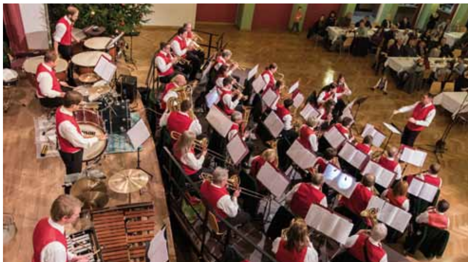
Bild: Die MusikerInnen geben verschiedene Stücke zum Besten.