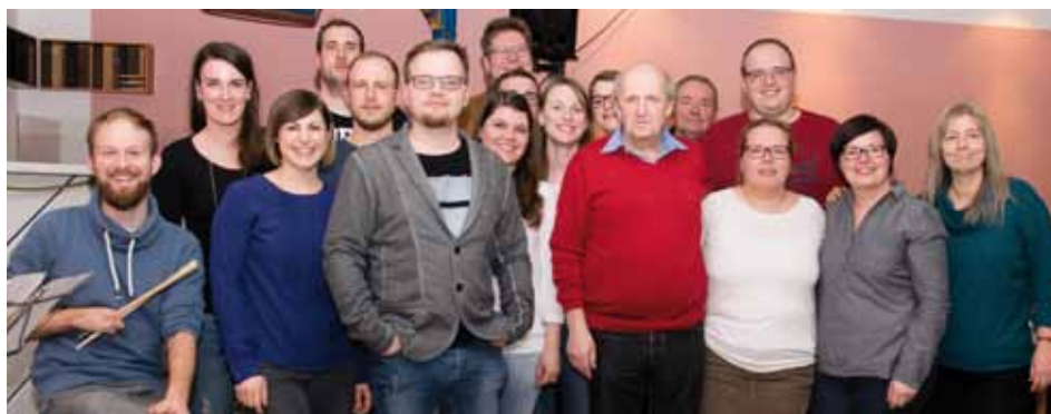
Bild: Der neugewählte Vereinsvorstand