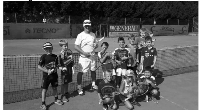
Fun & Action am Tennisplatz (UTC Haidershofen)

Unter dem Motto "Buntes Behamberg" hat das Referat für Jugend und Familie wieder ein tolles Freizeitprogramm für unsere Kinder zusammengestellt. Inzwischen ist die Aktion ausgelaufen und wir freuen uns mit den Kindern bereits auf die Ferienspiele im nächsten Jahr. Danke an alle Beteiligten!