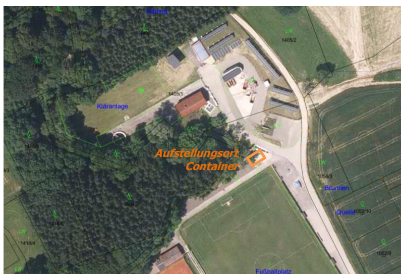
Aufstellungsort des Containers im ASZ Euratsfeld

Von abgestorbenen Buchsbäumen bzw. Buchsbaumteilen, die durch Rückschnitt anfallen, geht eine immense Gefahr der Weiterverbreitung des Buchsbaumzünslers aus. Daher hat sich der GVV Amstetten entschieden, Buchsbaumschnitt bzw. Pflanzenteile des Buchsbaumes von der Strauchschnittsammlung bis auf weiteres auszuschließen. Eine Beimengung von Buchsbaum, egal welcher Art, in die bestehenden Sammlungen für Strauchschnitt bzw. Grünschnitt oder Bioabfall ist nicht zulässig. Kleinmengen können über den Restmüll entsorgt werden.