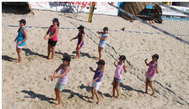
Die Tanzeinlage der Zumbakids aus Euratsfeld und Amstetten.