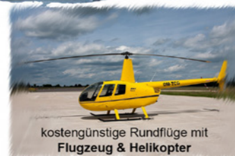
kostengünstige Rundflüge mit Flugzeug & Helikopter