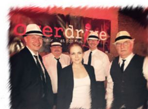
musikalische Unterhaltung von overdrive

selbst Pilot sein - testet das Gefühl im Ballon, Flugzeug und Helikopter