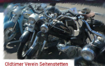
Oldtimer Verein Seitenstetten Puchtreffen Start eines 1000PS Sternmotors

31. JULI 2016, AB 10:00 UHR FLUGPLATZ SEITENSTETTEN