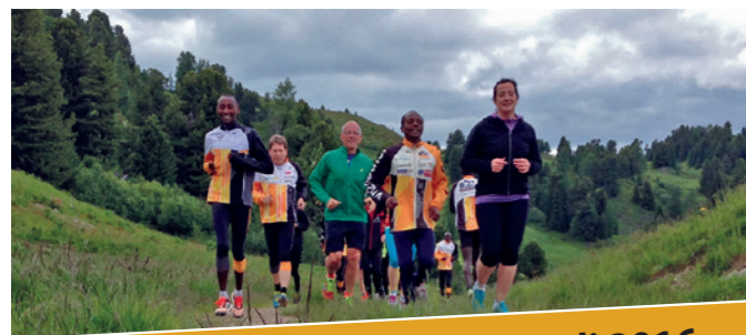
Laufwochenende 22. - 24. Juli 2016