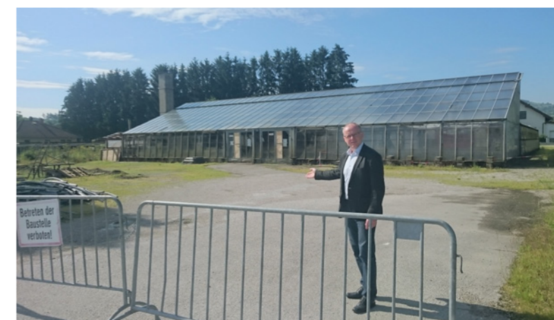
An dieser Stelle möchte die Fa. Hofer einen Lebensmittelmarkt errichten

Das Projekt wurde umgehend vom Gebietsbauamt begutachtet und an die Raumordnungsabteilung des Landes NÖ übermittelt. Es gilt nun zu klären, ob überhaupt von Seite der Raumordnung des Landes NÖ die Voraussetzungen für den Bau eines Lebensmittelmarktes vorliegen.