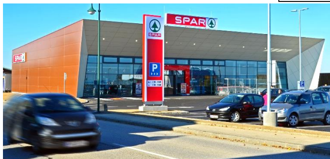
Der neue SPAR-Einkaufsmarkt, seit 21. Oktober geöffnet.