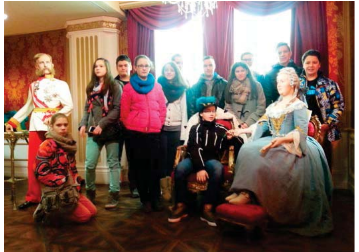
Besuch bei Madame Tussauds

Die Schüler der 4. Klasse besuchten unsere Bundeshauptstadt und kamen mit vielen unvergesslichen Eindrücken nach Hause.