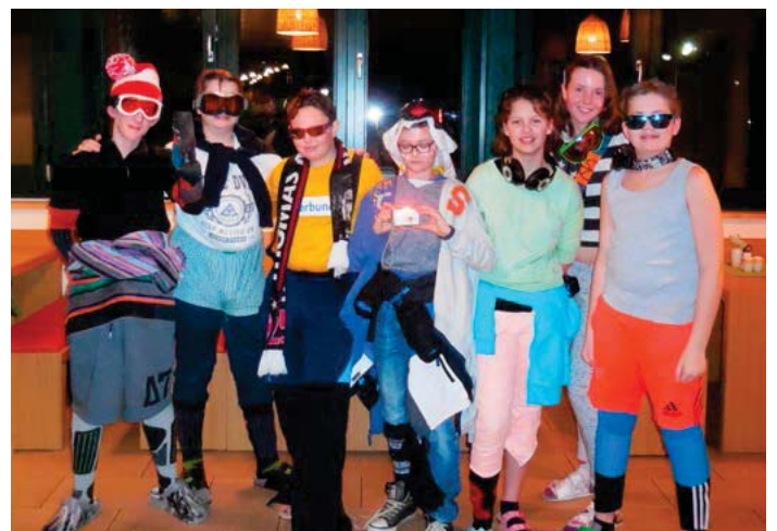
Und sie hatten auch am Abend noch genug Reserven zum Feiern!