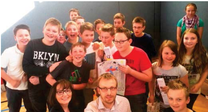
Selfie - aufgenommen mit der gerade gewonnenen Selfie-Stange!