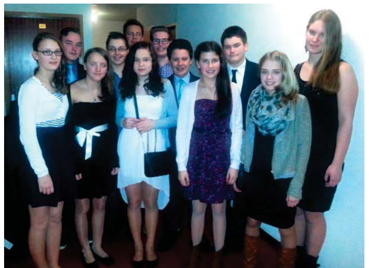
Hübsch gestylt vor dem Musicalbesuch: Mary Poppins.