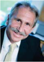
Karl Streicher Immobilienvermittlung