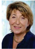
Herta Kaufmann Immobilienvermittlung