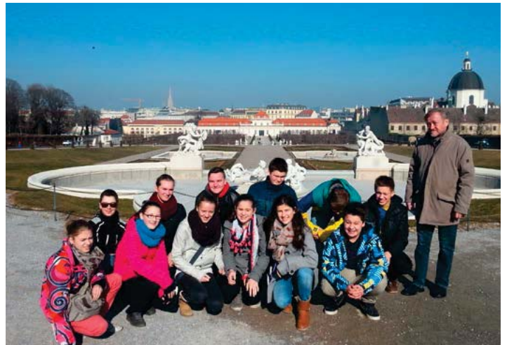
Im Park beim Schloss Belvedere