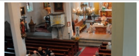
Die hl. Messe für die Jubelpaare des Jahres 2016 findet am 4. Juni 2016 statt.

um 17:00 Uhr in der Pfarrkirche statt. Dazu sind alle Mitbürger herzlich eingeladen! Musikalisch umrahmt wir die hl. Messe vom Chor SEHO.