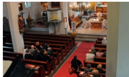
Die hl. Messe für die Jubelpaare des Jahres 2015 findet am 6. Juni 2015 statt.

ben werden musste. Wir bitten um Verständnis.