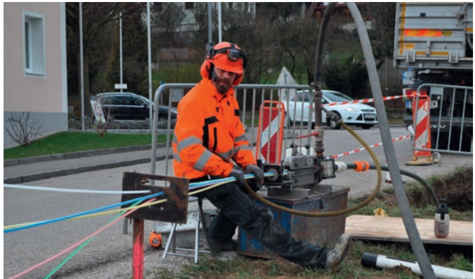
Viele Meter Glasfaserkabel wurden mittlerweile im Gemeindegebiet verlegt. Dies sorgt für schnellere Internetverbindungen.

Es ist durchaus möglich, dass sich die Geschwindigkeit auch nach der Aktivierung nicht verbessert. Dies kann