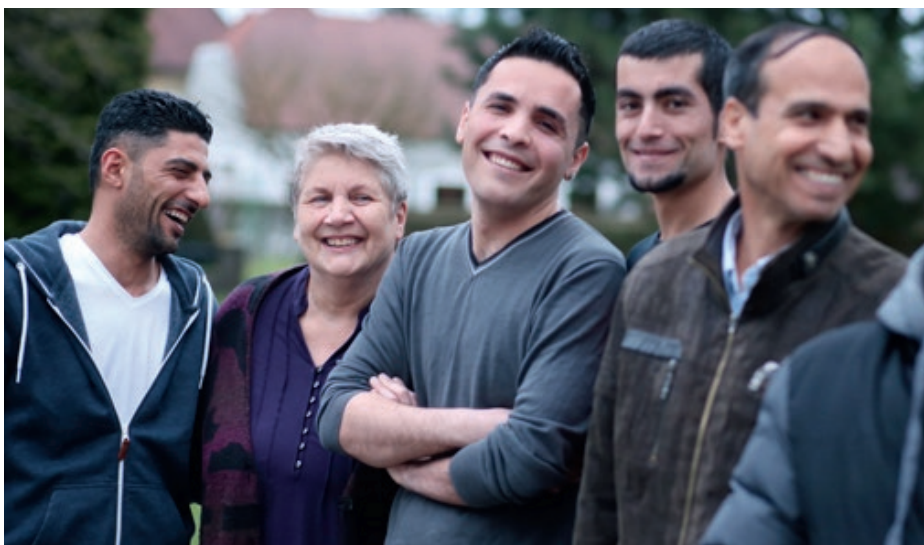
Hinter jedem Asylwerber steckt eine besondere Geschichte.