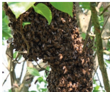
Wenn Sie einen Bienenschwarm im Garten finden, können Sie sich an einen Imker oder an das Schwarmtelefon wenden.

denn ohne gute imkerliche Pflege wird ein wild lebender Bienenschwarm über kurz oder lang eingehen.