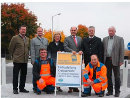
Der neue Kreisverkehr im Ortsgebiet trägt zur Verkehrssicherheit bei.