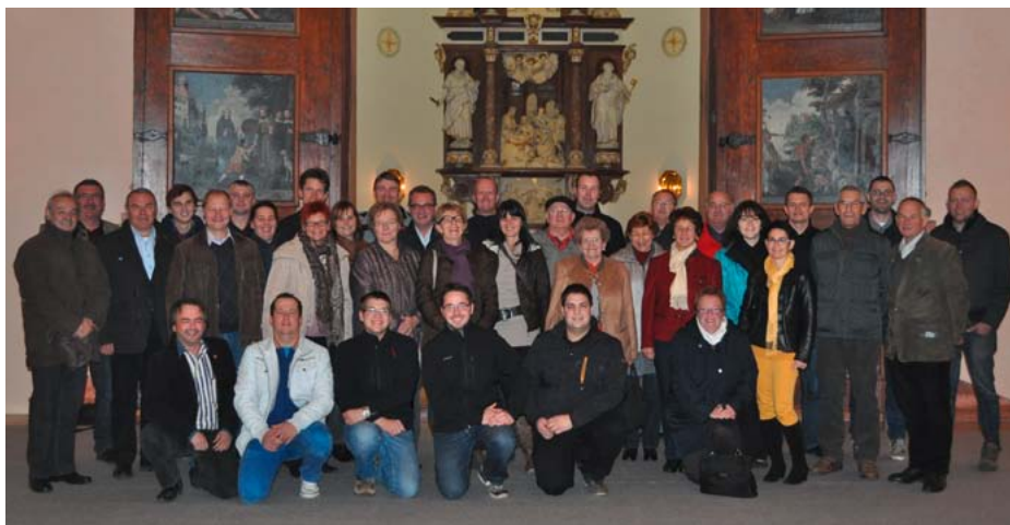
Die Verantwortlichen der Vereine und Körperschaften wurden von der Marktgemeinde zum Vereinsstammtisch eingeladen, um den Veranstaltungskalender für das Jahr 2013 zu besprechen. Zuvor wurde das Schloss Greinburg besichtigt.