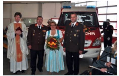
Im Mai 2013 wurde das neue Vorausrüstfahrzeug seiner Bestimmung übergeben.

Bei einer Gala im Festspielhaus St. Pölten sind die Kulturpreise des Landes Niederösterreich verliehen worden. Die