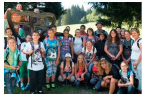
Die Kinder der MHS Blindenmarkt besuchten das Hochmoor Leckermoos.

Das Hochmoor Leckermoos wurde im Jahr 1984 zum Naturschutzgebiet erklärt und hat eine Fläche von 25 ha. Die SchülerInnen hatten großen Spaß an den 11 Stationen rund um das Leckermoor und den Schwebesteg.