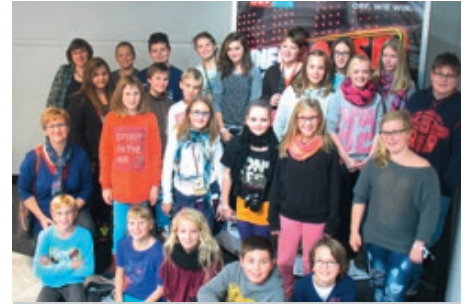
Im ORF Zentrum in Wien erhielten die Schüler einen Blick hinter die Kameras.

Den Höhepunkt der Führung stellte das Erlebnisstudio dar. Dort durfte man vor und hinter der Kamera agieren, den Bluebox-Effekt erleben und