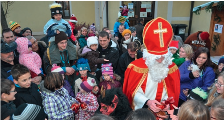
Großer Andrang herrschte beim Christkindlmarkt, als der Nikolaus den Kindern kleine Präsente überreichte. Weitere Bilder finden Sie auf www.adventmarkt.org