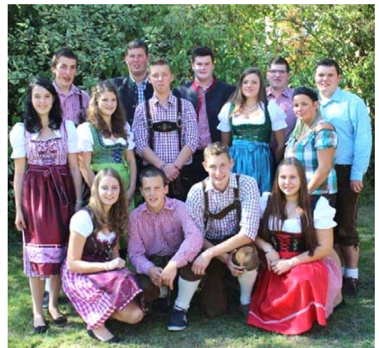
Am Bild der neue Vorstand der Landjugend Zeillern.