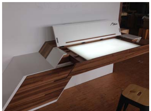
Das Meisterstück des Jung-Tischlermeisters

Die Gratulation für die Neugeborenen wird am Dienstag, 06.10.2015, um 16.00 Uhr im Zeillerner Kindergarten erfolgen.