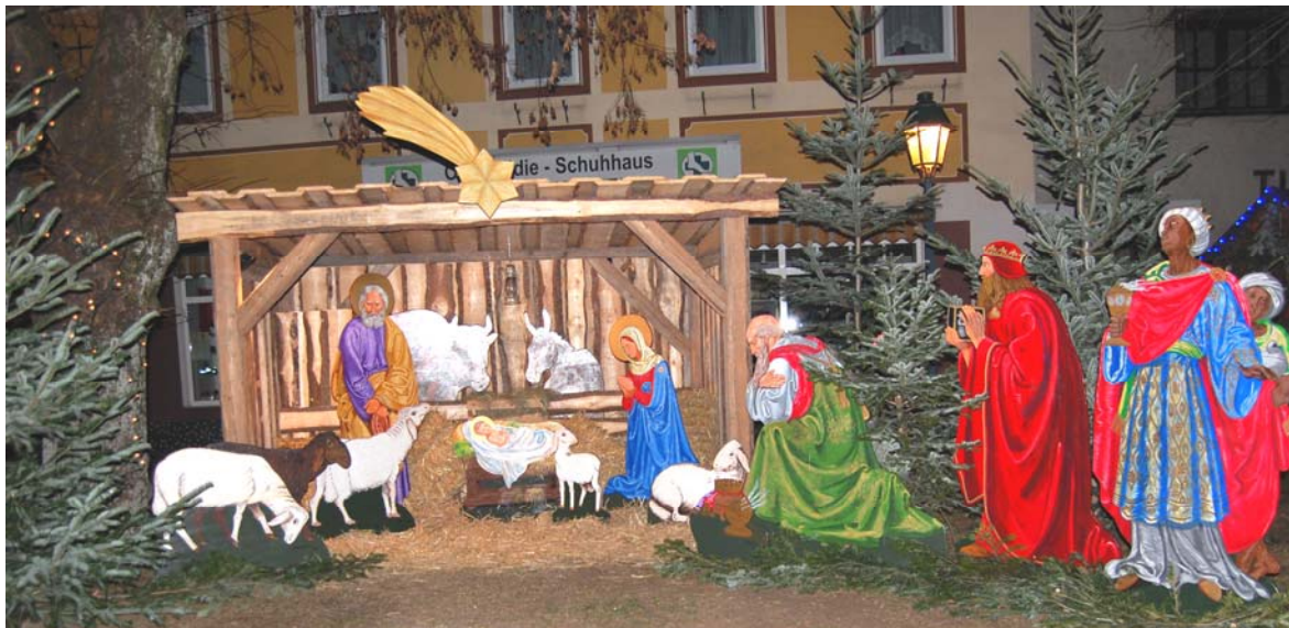
Adventkrippe des Ortsentwicklungsvereins „Gemeinsam für Blindenmarkt“ am Marktplatz

Abschließend wünsche ich Ihnen und Ihren Familien ein schönes besinnliches Weihnachtsfest , stressfreie Feiertage im Kreise Ihrer Lieben sowie alle guten Wünsche, Zufriedenheit und Gesundheit für das kommende Jahr .