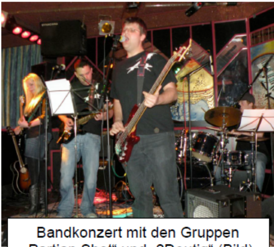
Bandkonzert mit den Gruppen „Partian Shot“ und „2Deutig“ (Bild)