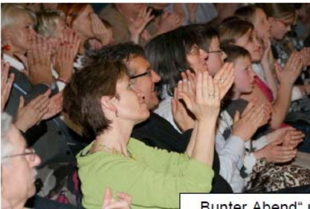
„Bunter Abend“ und „Ausstellung mit musikalischen Darbietungen der MHS Blindenmarkt