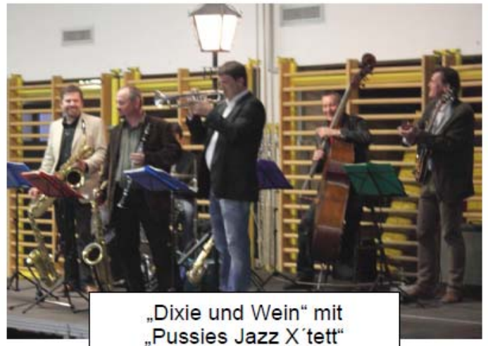
„Dixie und Wein“ mit „Pussies Jazz X'tett“