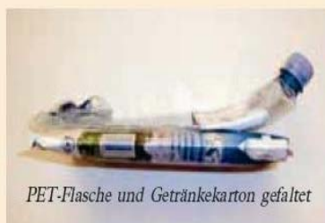
PET-Flasche und Getränkekarton gefaltet

Folgende Abfälle gehören NICHT in die Kunststoffverpackungstonne: