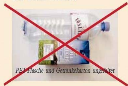
PET-Flasche und Getränkekarton ungefaltet