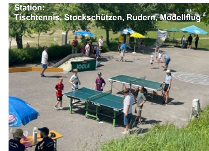
Station: Tischtennis, Stockschißen, Rudern, Modellflug