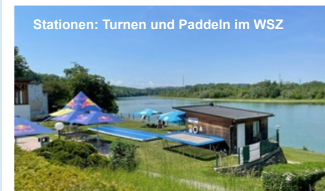
Stationen: Turnen und Paddeln im WSZ