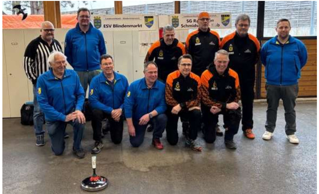
Foto: ESV, 1.Landesliga Spiel Ende März in der Union Halle Amstetten gegen SG Raiffeisen Schmidsdorf – Küb

Neben diesen Bewerben ist der ESV Blindenmarkt auch im NÖ Cup vertreten und bei weiteren Turnieren während