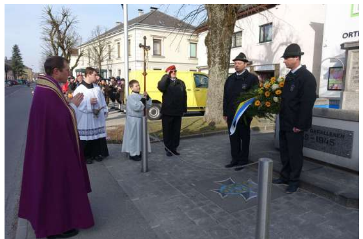
Kranzniederlegung beim Kriegerdenkmal