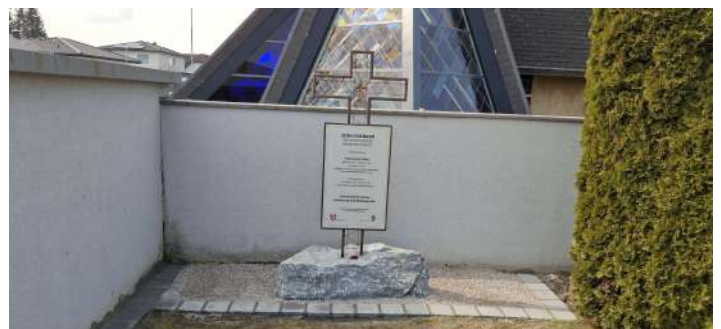
Die neue Gedenkstätte am Friedhof in Blindenmarkt