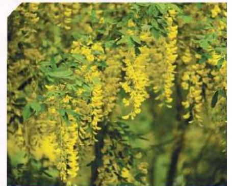
Goldregen: Schoten und Samen sind giftig!

Die Verbreitung der Giftpflanzen ist vielfältig: Giftpflanzen aus der Natur, Gartenpflanzen/Ziergehölze, Zimmerpflanzen und Neophyten. Dabei sind Pflanzen wie Maiglöckchen, Christrose oder Efeu sowohl Natur- als auch Gartenpflanzen.