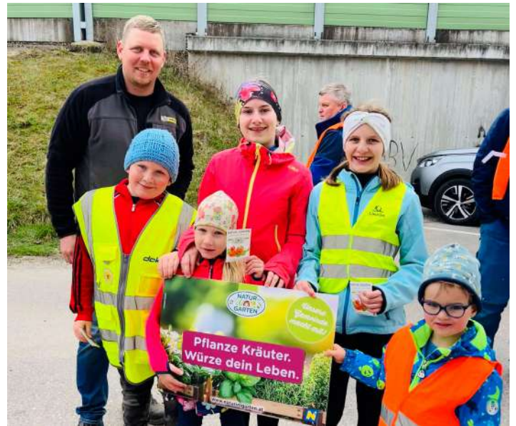
oben: Verteilung beim Blindenmarkter Frühjahrsputz, unten: Verteilung bei der Baumpflanzaktion in Kottlingburgstall

Als Impuls zum Mitmachen beteiligte sich die Marktgemeinde Blindenmarkt auch heuer an der Samensackerl-Verteilaktion von „Natur im Garten“. Kostenlose Samensackerl mit Kapuzinerkresse wurden bereits ausgegeben – am Gemeindeamt liegen noch Restmengen zur Abholung auf. Bei Interesse bitte gerne vorbeikommen.