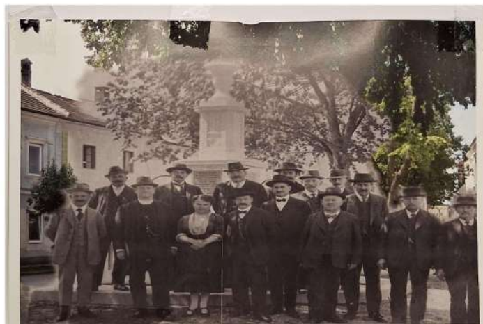
Komitee Einweihung KDM Ortsmitte 1922