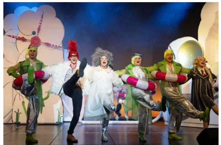
Frau Holle, HERBSTTAGE BLINDENMARKT, Foto: Lukas Beck

Kartenbüro Herbsttage Hauptstraße 17, 2. Stock 3372 Blindenmarkt 07473 66680 karten@herbsttage.at Freitag 10:00 bis 12:00