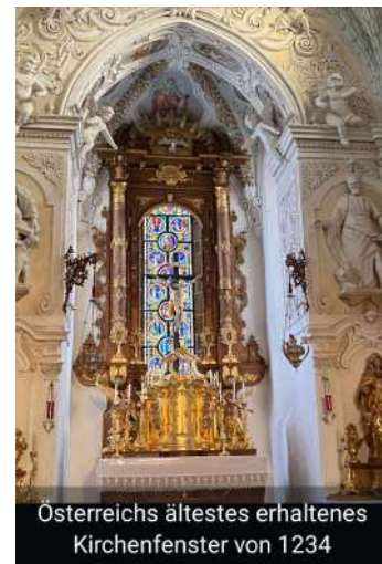
Osterreichs ältestes erhaltenes Kirchenfenster von 1234

Im Anschluss hatten wir noch eine Kirchenführung, wo wir das älteste Kirchen- fenster, die Lourdes Grotte, die Krypta und den Kreuz- gang bewundern konnten. Fazit: Ein schöner Sonntag- Nachmittag in gemütlicher Runde!