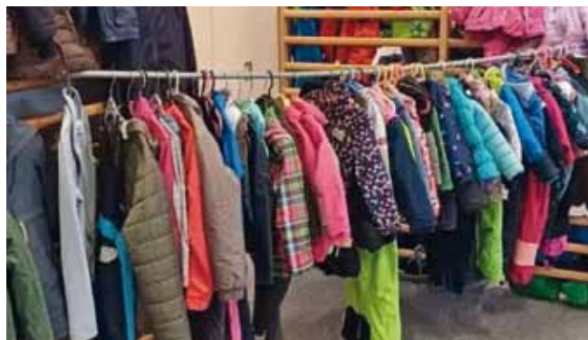
Foto: Zahlreiche Winterartikel fanden beim Umtauschbasar eine weitere Verwendung.

herzliches Dankeschön gilt dem engagierten Team rund um Nicole Wurz, das mit großem Einsatz bei der Warenan- und ausgabe, dem Aufbau und Trampieren der Artikel und auch der Organisation im Vorfeld zum Gelingen der Veranstaltung beitrug. Schon jetzt freut sich die Gesunde Gemeinde auf den nächsten Umtauschbasar im Frühling.