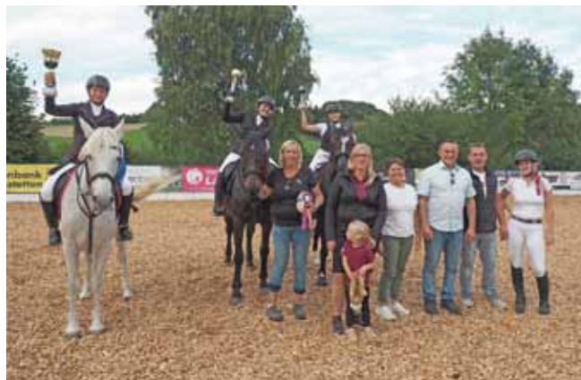
Mit einem 2-tägigen Fest feierte der Reitverein Neustadtl-Kollmitzberg sein 30-jähriges Bestandsjubiläum.