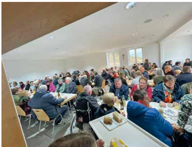
Foto: Bei einer Agape im Pfarrheim konnte die Räumlichkeiten im neuen Pfarrheim besichtigt werden.

gramm. Der Außenbereich, die Asphaltierung und Gestaltung, befindet sich derzeit noch in Fertigstellung. Im nächsten Schritt können die Gemeindefürsorge in den darüberliegenden Geschossen hergestellt und bezogen werden. Ein herzlicher Dank gilt den zahlreichen engagierten Helferinnen und Helfern der Pfarre sowie allen Unterstützerinnen und Unterstützern. Das Ergebnis kann sich sehen lassen – ein wirklich gelungenes gemeinsames Projekt!