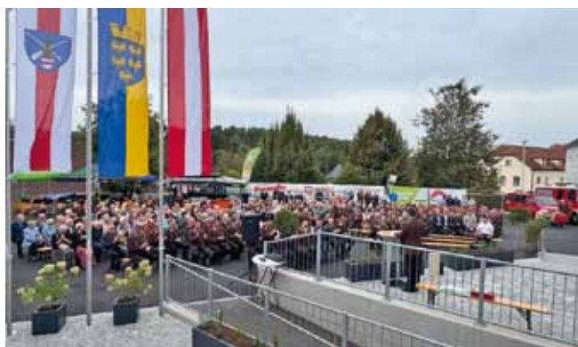
Foto: Große Anteilnahme an den Festlichkeiten auch von der Ortsbevölkerung bei der feierlichen Eröffnung.