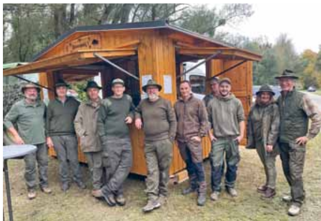
Foto: Bei der Labstelle der JägerInnen in der Au wurde man mit Speis und Trank bestens versorgt.

Start im Donauwellenpark weg gefolgt. Neben der Strecke, welche durch die Donauau führte, waren auch die Labstellen bestens durchgeplant und so gut besucht, dass am Ende „alles aus“ war. Vielen Dank an alle, die organisiert und mitgeholfen haben!