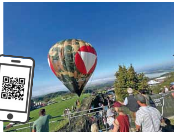
Foto: Tolle Attraktionen des Öst. Bundesheeres beim Kirtag.