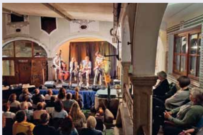
Foto: 10-jähriges Bühnenjubiläum der Quetschworkfamily am Hauerhof in Ardagger Stift.

gie. Auch diesmal begeisterten sie das Publikum mit pointierten Liedtexten, die zum Nachdenken und Schmunzeln einladen und einer musikalischen Darbietung, die zwischen feinsinnig und kraftvoll pendelte. Das Jubiläum wurde zu einem echten Erlebnis. Danke an den Kulturverein Kimst'a für die gelungene Organisation des Abends.