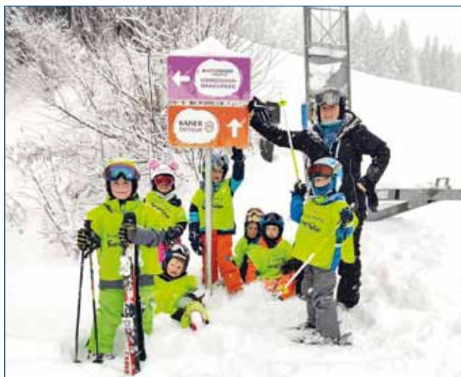
Foto: Die kleinen NachwuchsskifahrerInnen mit ihrer Betreuerin beim Kindergartenskikurs 2022 auf der Forsteralm.

Wenn Sie gerne bei der Organisation mithelfen oder als Begleitperson mitfahren möchten, dann melden Sie sich bitte einfach am Gemeindeamt unter T: 07479/73 12 oder bei der Arbeitskreisleiterin der Gesunden Gemeinde Ardagger Michaela Salzmann-Naderer unter T: 0650/830 31 80 bis Ende November 2025 . Wir freuen uns auf Ihre Unterstützung und natürlich auf viel Bewegung und Spaß im Schnee.