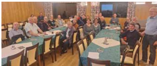
Foto: Die TeilnehmerInnen des Jubiläumsstammtisches.