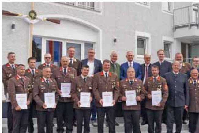
Foto: Ehrungen ergingen an verdiente Personen rund um den Feuerwehrhaus-Umbau.

Die Kosten für den Umbau beliefen sich auf rund 1,3 Millionen Euro. Sie wurden zu je einem Drittel von der Feuerwehr, der Gemeinde und dem Land getragen. Innenminister Karner würdigte das neue Haus bei einem Rundgang und hob die Bedeutung des ehrenamtlichen Engagements hervor.