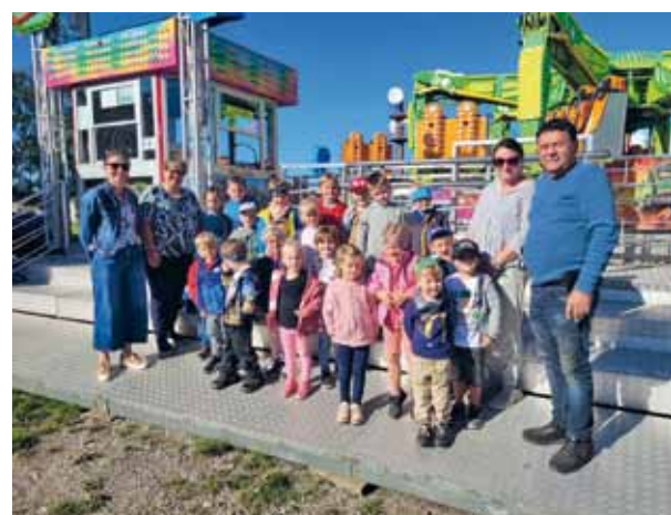
Die Kindergartenkinder zu Besuch am Rummelplatz.