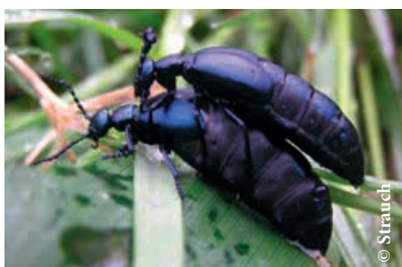
Der Ölkäfer ist ein Vertreter der über 1.000 heimischen Käfer in Österreich.

Österreich ist im Vergleich zu anderen Ländern Mitteleuropas einer der artenreichsten Staaten. Rund 68.000 Arten, davon ca. 54.000 Tierarten und 3.462 Farn- und Blütenpflanzen, kommen in Österreich laut Umweltbundesamt vor. Die größte Gruppe machen Insekten mit rund 40.000 Arten aus.