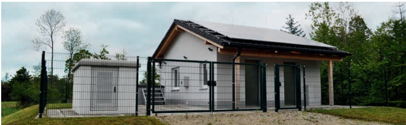
Bestes Trinkwasser bezieht die Marktgemeinde St. Georgen am Ybbsfelde aus der Wasserversorgungsanlage Doislau.

St. Georgen, Krahof, Thalling, Doislau) durchgeführt und so beurteilt: „Die Indikator- und Parameterwerte der Trinkwasserverordnung wurden - im Rahmen des Untersuchungsumfanges - eingehalten.“ Die Laboruntersuchung wurde von AGROLAB Austria GmbH, 4714 Meggenhofen durchgeführt.