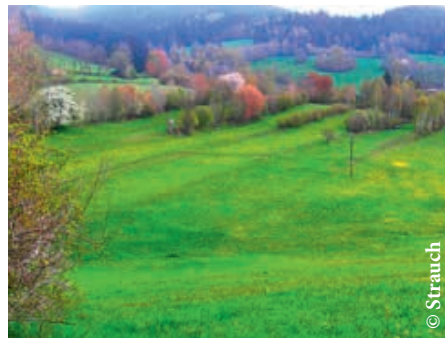
Wiesen, Brachen, Hecken und kleine Wäldchen – eine große Vielfalt an Ökosystemen.

können und daraus müssen wiederum gesunde, fortpflanzungsfähige Nachkommen entstehen. Das funktioniert eben bei Dogge und Dackel, nicht aber bei Pferd und Esel.