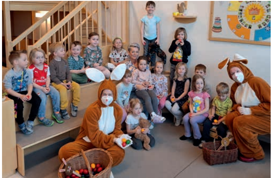
Die Osterhasenaktion der Marktgemeinde St. Georgen/Y. sorgte für strahlende Kinderaugen.

Weitere Bilder finden Sie in der Online-Galerie.