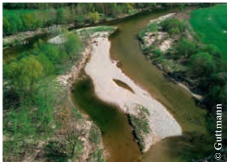
In unseren Ybbs-Auen ist die Vielfalt an verschiedenen Lebensräumen gut erkennbar.

bauchunke braucht im Frühjahr die Wasserlacke und im Winter die dicke Laubschicht im angrenzenden Wald.