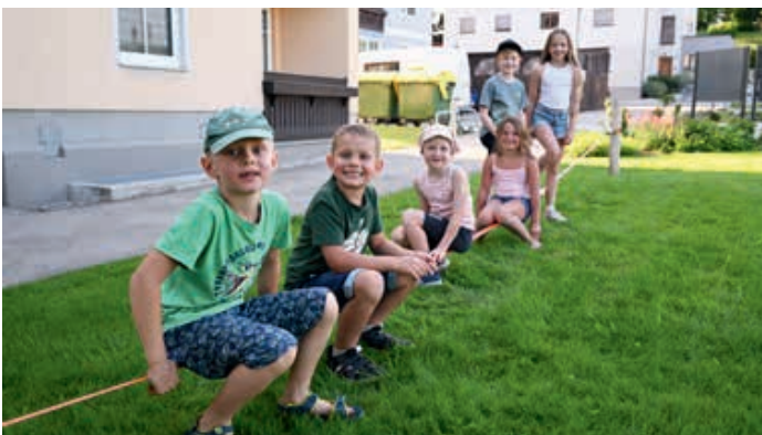
Die neuen Spielgeräte wurden gleich ausgetestet...