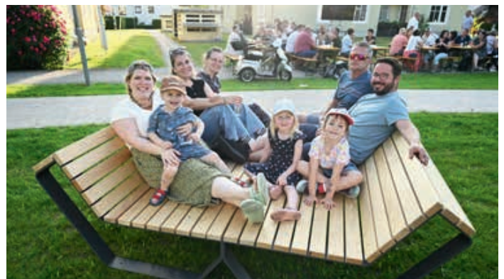
... und auch die neuen Liegeflächen sorgten für Begeisterung.