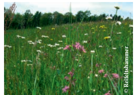
Die bunte Blumenwiese ist ein unglaublich artenreiches Biotop.

Der Lebensraum und seine darin ablaufenden Wechselwirkungen werden als Ökosystem bezeichnet. Einfacher ausgedrückt: Die Blumenwiese in Krahof mit ihren hunderten Pflanzen- und Insektenarten ist ein artenreiches Ökosystem.