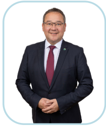
Bürgermeister Klaus Nagelhofer