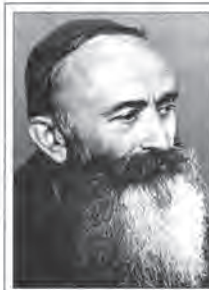
Pater Laurenz Mock

PT. - Das 8. Buswartehäuschen stellte am 30. Oktober 1999 die JVP-Euratsfeld in Schnotzendorf auf. Rund 180 Stunden unentgeltliche Arbeitszeit wurden geleistet, die Materialkosten wurden wieder von der Gemeinde getragen. Den Grund für das Buswartehäuschen stellte dankenswerterweise Frau Elfriede Pichler zur Verfügung.