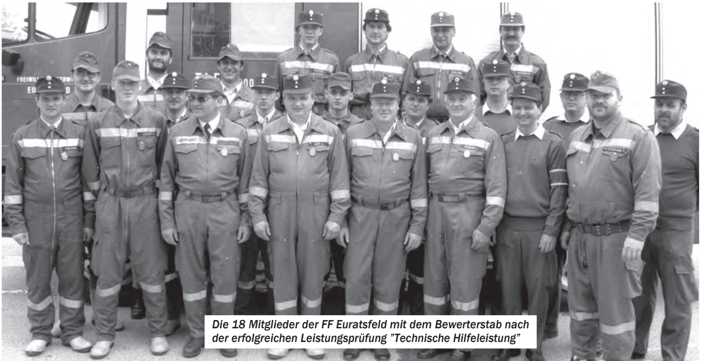
Die 18 Mitglieder der FF Euratsfeld mit dem Bewerberstab nach der erfolgreichen Leistungsprüfung "Technische Hilfeleistung"