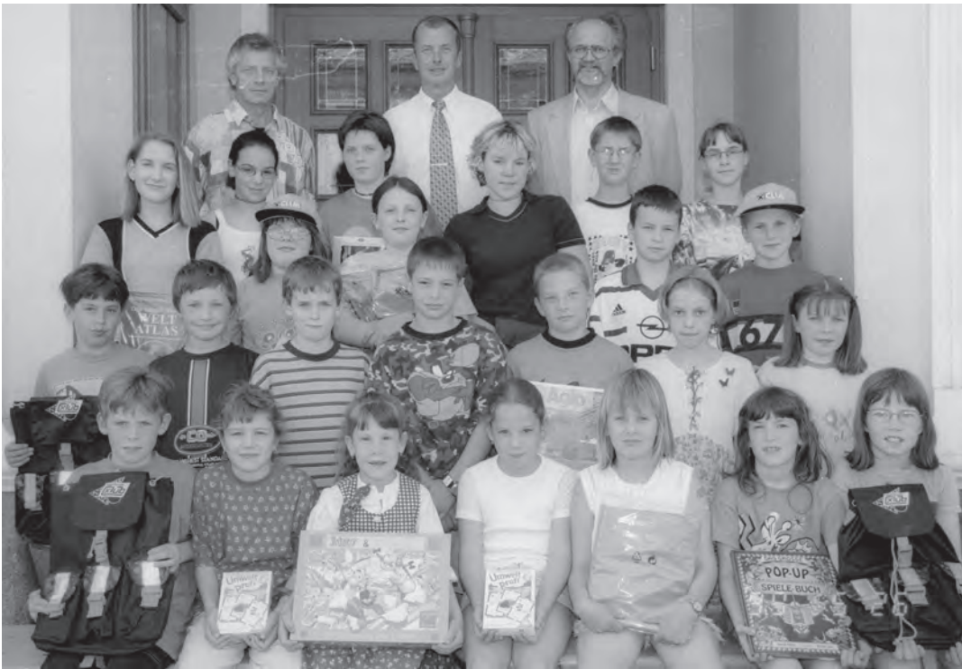
Preisverleihung Raiffeisen- Jugendbewerb am 26. Mai 1999