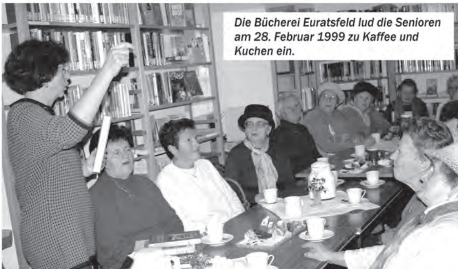
Die Bücherei Euratsfeld lud die Senioren am 28. Februar 1999 zu Kaffee und Kuchen ein.