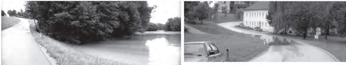
Oben: Fotos vom 10. Juli 1999

Starke Regenfälle führten zu Überflutungen auch in Kalkstechen. Als Schwachstelle zeigte sich abermals der Durchlass zwischen Grießenberg und Kalkstechen, wo immer wieder großflächige Überschwemmungen von landwirtschaftlichen Flächen und der Landesstraße beim Haus Maurhart entstanden.