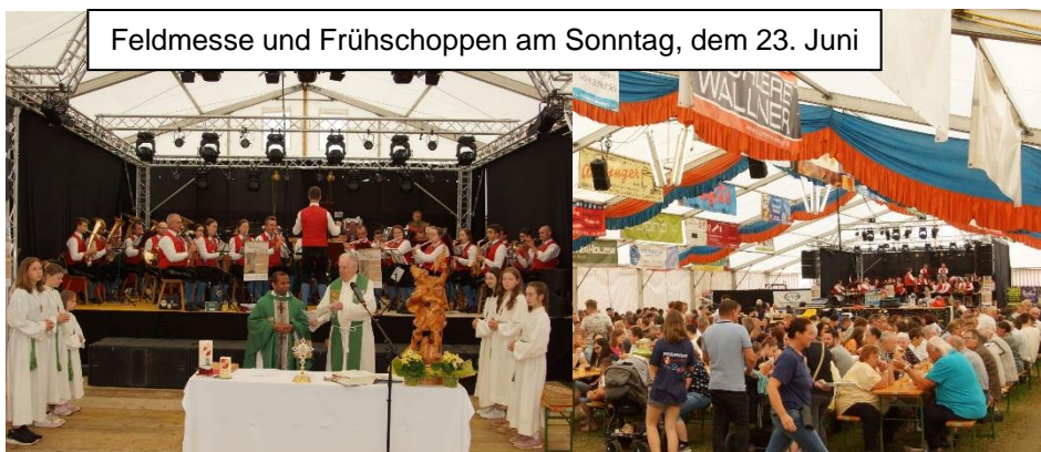
Feldmesse und Fröhschoppen am Sonntag, dem 23. Juni