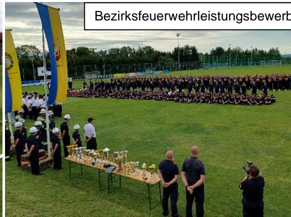
Bezirksfeuerwehrleistungsbewerbe am Samstag, dem 22. Juni