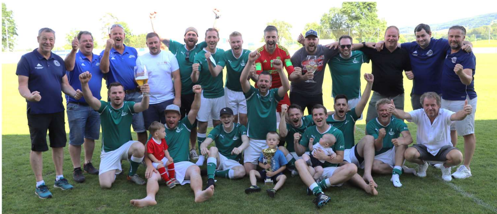
die Siegermannschaft „Mein persönlicher Favorit“