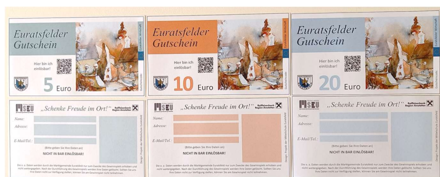
Bild: Der neue Euratsfelder Einkaufsgutschein

Danke für eure sensationellen Arbeiten und Gratulation dazu!