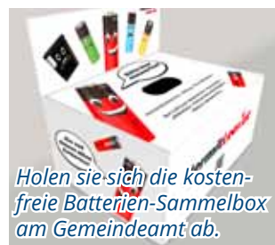
Holen sie sich die kostenfreie Batterien-Sammelbox am Gemeindeamt ab.