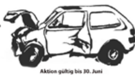
Aktion gültig bis 30. Juni

Um nur € 100,- inkl. MwSt. von der Sammelstelle Bezirk Amstetten