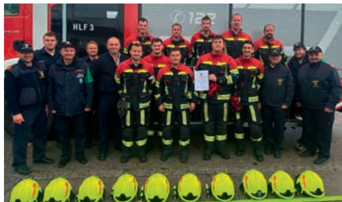
Technische Ausbildungsprüfung in Gold