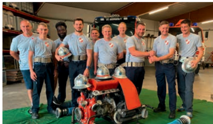
Sponsoring unserer Wettkampfgruppe durch Intersport Winner

Unsere Kameraden der Wettkampfgruppe haben im vergangenen Jahr beachtliche Erfolge erzielt, mit Top-Platzierungen bei verschiedenen Bewerben. Dieses herausragende Ergebnis unterstreicht nicht nur ihre Fähigkeiten, sondern auch ihr tiefes Engagement und die harte Arbeit, die sie in die Vorbereitungen investiert haben.