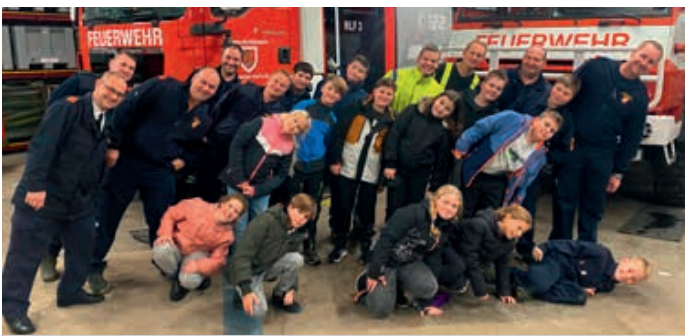
Gemeinsame Jugendausbildung mit der FF-Krahof