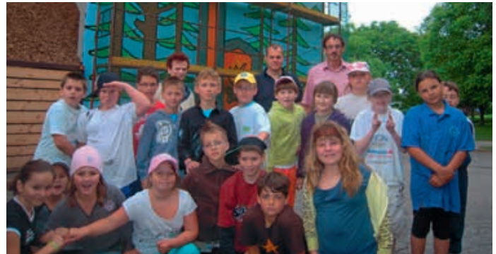
Malwettbewerb 2011: Thema „Heizen mit Holz“

2015 wurde ein Feinascheabscheider montiert und damit unsere Abgaswerte noch mehr verbessert. Im Juni 2023 haben wir eine PV-Anlage mit 13 KW-Peak am Dach des Heizwerkes, einen 10kw Wechselrichter und eine 20 KW Stromspeicher montiert und wollen damit einerseits langfristig Kosten einsparen und noch mehr für unsere Umwelt tun.