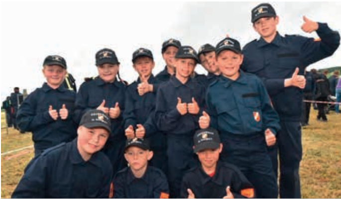
Jugendlager 2023 in Winklarn