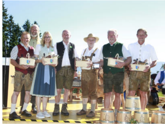
Geschenklagl für das Organisationsteam