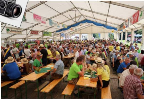
Tausende Besucher auf der Garnbergalm