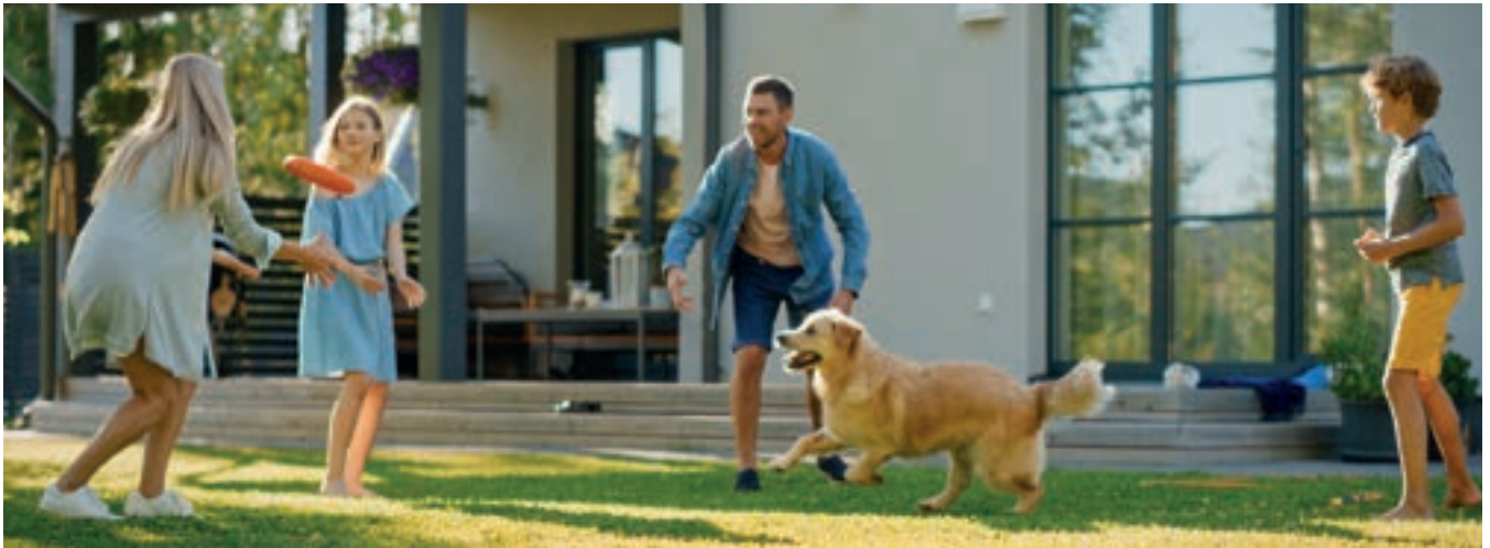
WEBSITE www.messewieselburg.at