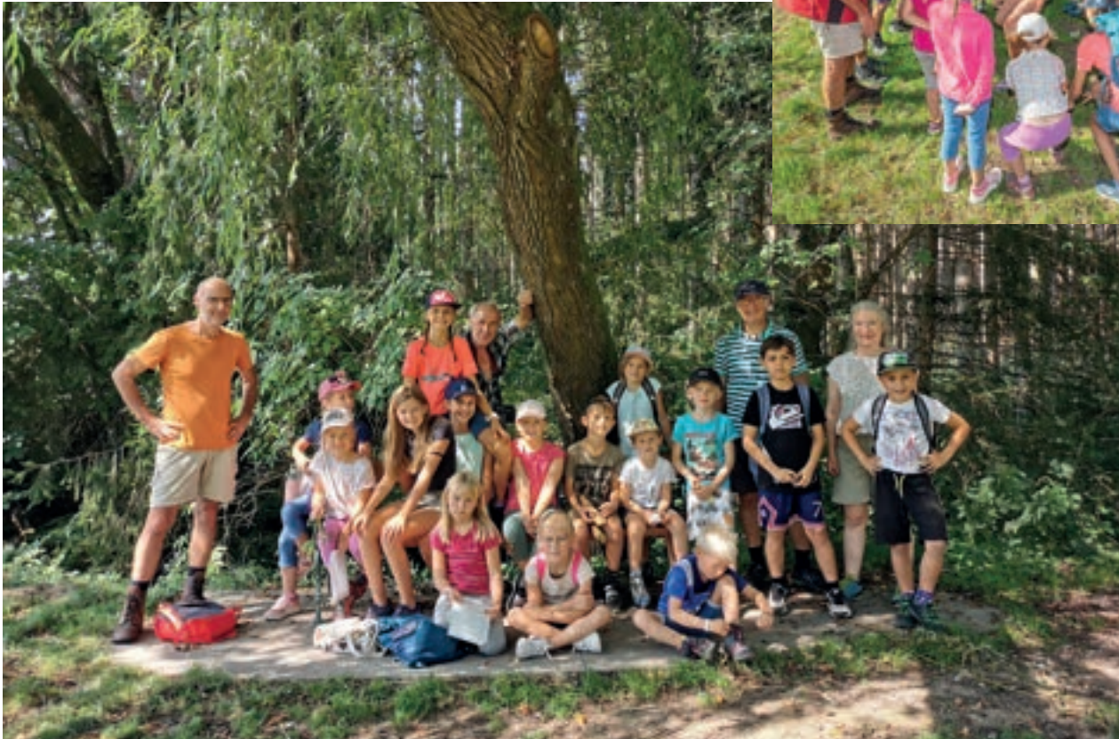
Die Walddetektive am 17. August 2023