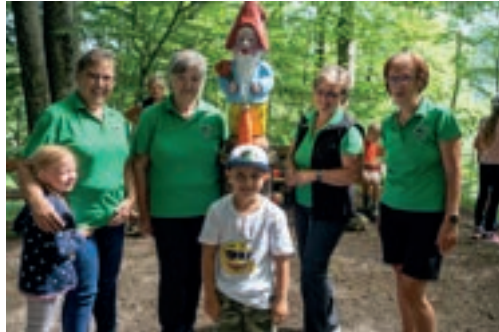
Wanderfahrt am Kreuzberg zum Zwergerlweg am 27. Juli 2023