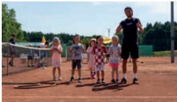
Tennis- und Padelschnuppertag am 14. Juli 2023