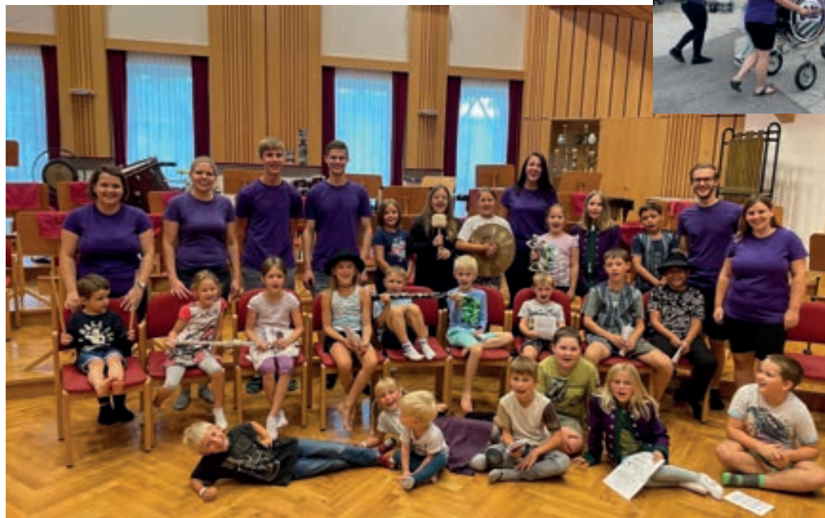
Musikalischer Nachmittag am 4. August 2023