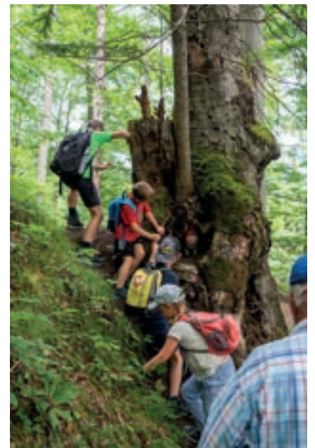
Fahrt in die Römerwelt am 3. August 2023