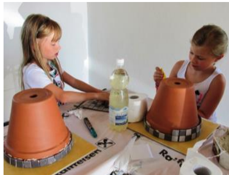
Keramikarbeiten Siedlerverein Haidershofen