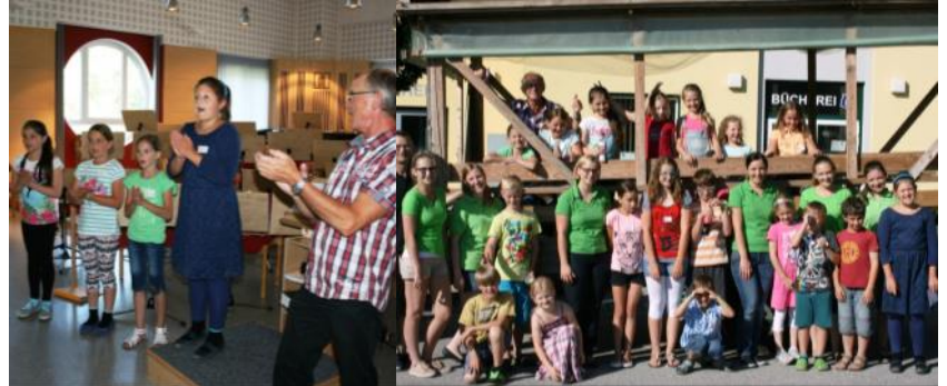
Spiel & Spaß Musikverein Haidershofen