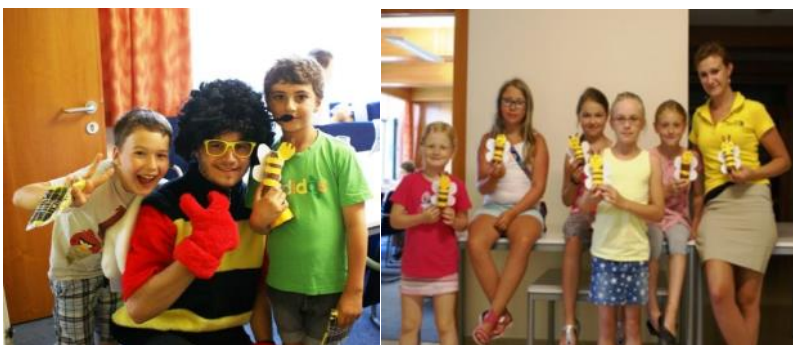
Zwischen Gold und Geld Raiffeisenkasse Haidershofen