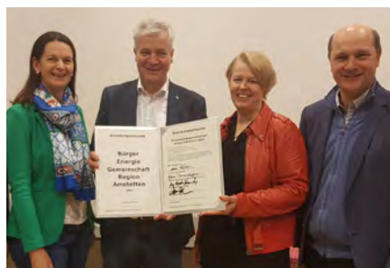
Gründung der BEG Region Amstetten

Erneuerbaren Strom im eigenen Nahbereich zu erzeugen und lokal verfügbar zu machen, ist Zweck der Bürgerenergiegemeinschaft (BEG) Region Amstetten, die sich in Form einer Genossenschaft gegründet hat.