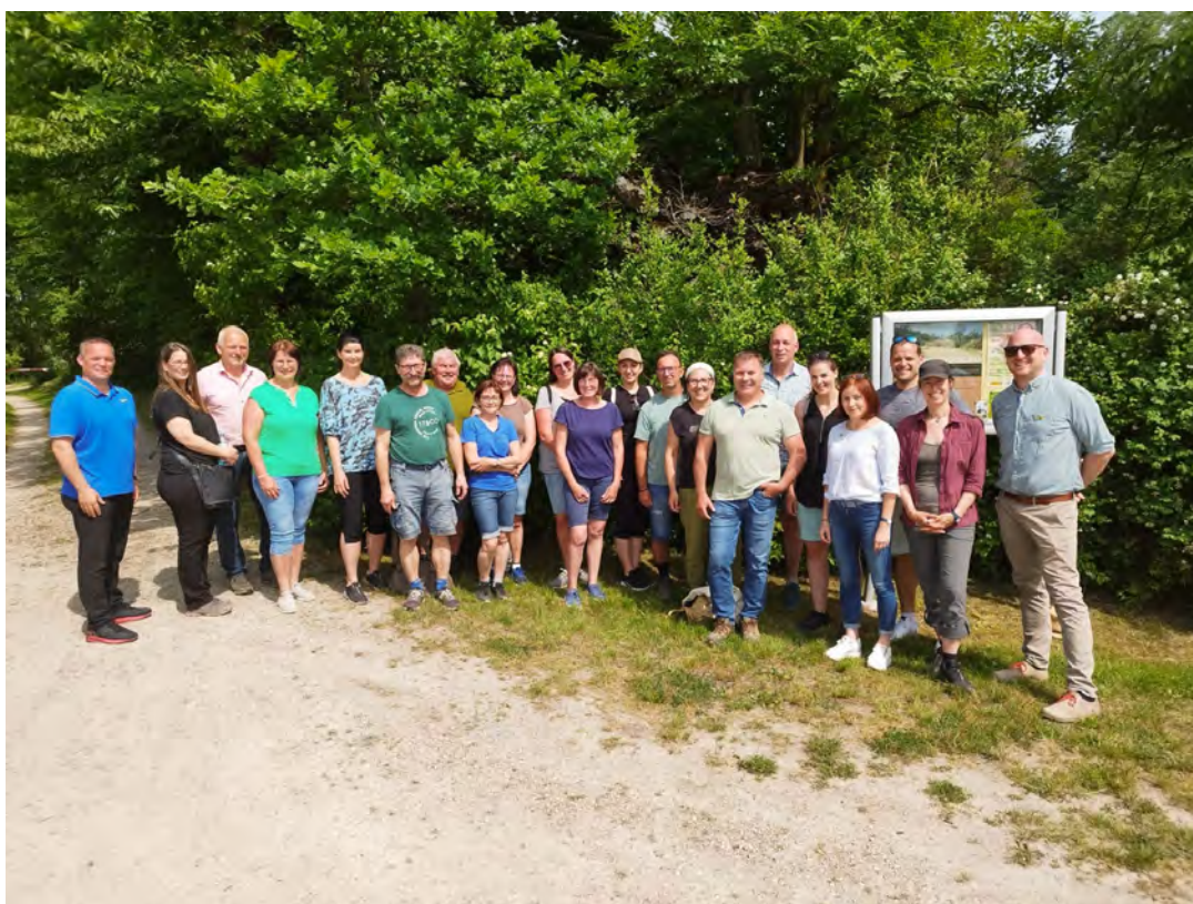
Die GemeindevertreterInnen und Projektpartnerinnen freuen sich über das Naturjuwel Doislau

Das Projekt ergänzte, mit Schulworkshops, einer Weiterbildung für Pädagoginnen und Exkursionen, die Pflegemaßnahmen zum Erhalt der Heißländern in der Doislau, die im Rahmen der Schutzgebietsbetreuung NÖ seit längerem laufen. „Der Erhalt unseres einzigartigen Naturjuwels „Doislau“ ist uns ein großes Anliegen“, sind sich die engagierten GemeindevertreterInnen, bei denen das Thema Naturschutz großgeschrieben wird, einig. „Daher war es für uns wichtig, im Rahmen der Wanderung Informationen über den aktuellen Stand der Naturschutzgüter vor der Haustüre und zukünftig notwendige Erhaltungsschritte dafür zu erhalten“, so das Resümee der GemeindevertreterInnen.