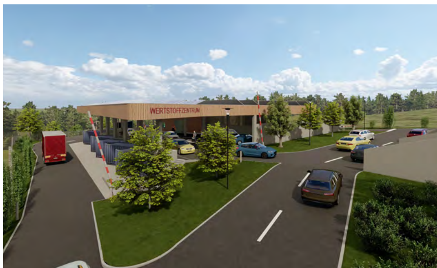
Das WSZ in Euratsfeld soll in der 2. Jahreshälfte in Betrieb gehen

Aktuelle Informationen zu den Wertstoffzentren können auch auf der GDA-Homepage unter https://gda.gv.at/wertstoffzentren abgerufen werden.