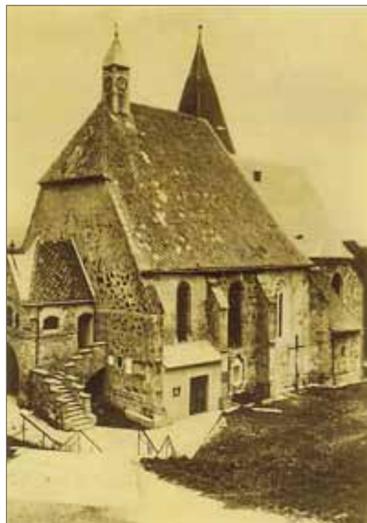
Die ehem. Kirche Stephanshart wurde in den 1960er-Jahren wegen Rutschung abgetragen.