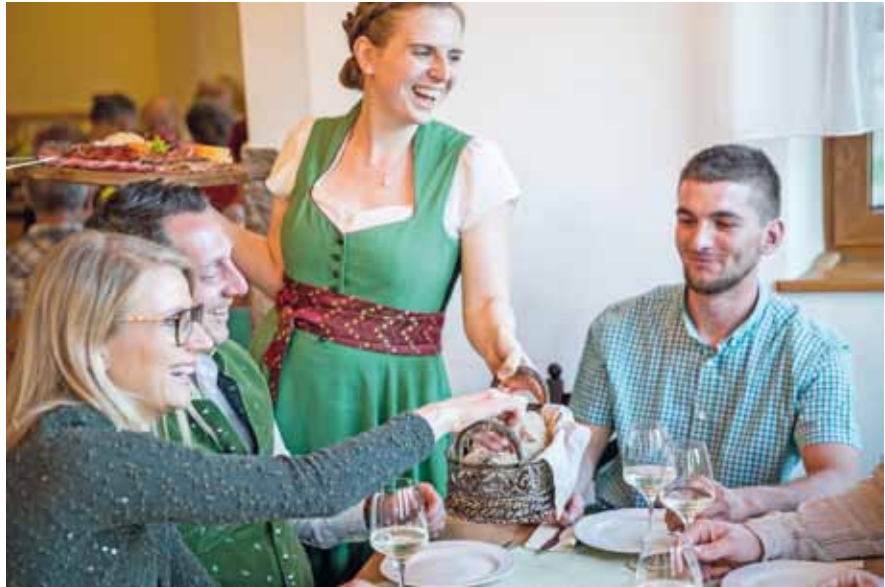
Foto: Gastfreundschaft, Herzlichkeit und Freundlichkeit wird sehr geschätzt und bleibt den Gästen in Erinnerung.

Und schließlich entwickelt sich auch der Sport immer weiter zu einer riesen großen verbindenden Klammer für unsere Markt-gemeinde Ardagger. Erfolge, wie wir sie gerade jetzt 2023 beim Fußball feiern, schweißen auch unsere Gemeinde zusammen. Und es wird in Zukunft auch zwischen den Vereinen und Ein-satzorganisationen in allen vier Katastralgemeinden enger zu-sammengearbeitet werden. Bei den Freiwilligen Feuerwehren sowieso und im heurigen Jahr steht das große gemeinsame Blasmusikkonzert unserer vier Musikkapellen stellvertretend für eine katastralgemeinden-übergreifende Kooperation.