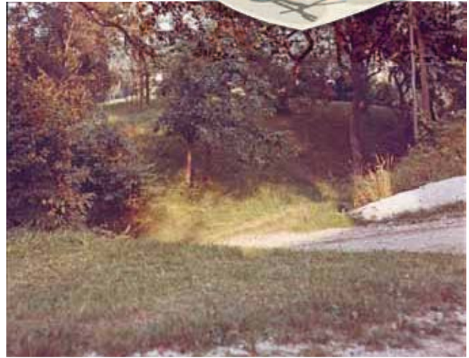
Abb. 4: Hausberg „Eisern Birn“ in Leitzing mit Abschnittsgraben von Süden aus (1977).

Vielen Dank für die ausführlichen historischen Einschätzungen auf den Seiten 8 bis 11 von Harald Lehenbauer (Historiker) aus Wallsee-Sindelburg.