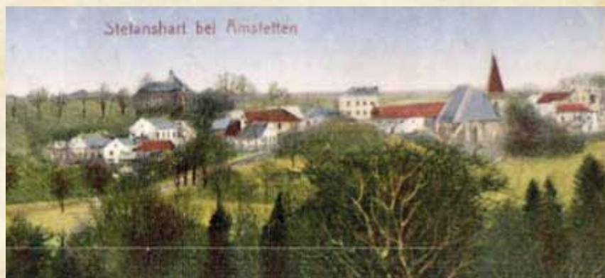
Diese Postkarte zeigt den Ort Stephanshart und die „ehemalige“ Kirche, die wegen Rutschung abgetragen werden musste.

jeweiligen Bürgermeister ab dem Jahr 1849 können den Gemeindechroniken entnommen werden. Reich waren die Gemeinden sicher nicht, denn sie hatten damals auch schon die Aufgaben von heute und die Einnahmen flossen sehr spärlich. Es ist anzunehmen, dass so mancher Bürgermeister etwas aus der eigenen Tasche zum Wohl der Gemeinde beigesteuert hat.