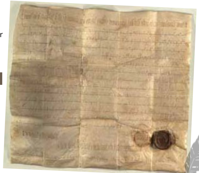
Foto: In der Urkunde aus dem Jahr 823 wurden zwei Kirchen „duas basilicas“ erwähnt.

Es ist berechtigt, davon auszugehen, dass eine der beiden „basilicas“ sich in Markt Ardagger befunden haben könnte, da sich an diesem Ort ein wichtiger Landeplatz am Hauptverkehrsweg – der Donau – Richtung Osten befand. Der Heilige Nikolaus als Patron der Schiffsleute und der örtlichen Kirche verbindet diese beiden „Funktionen“ des beliebten Volksheligen, den die Schiffsleute vor der Einfahrt in den gefährlichen Strudengau gerne angerufen haben.