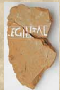
Abbildungen: Spätantike römische Ziegelstempel (um 370 n. Chr.) aus Moos. (Funde in Sammlung Karl Kreamslehner (Klein-Erla) .