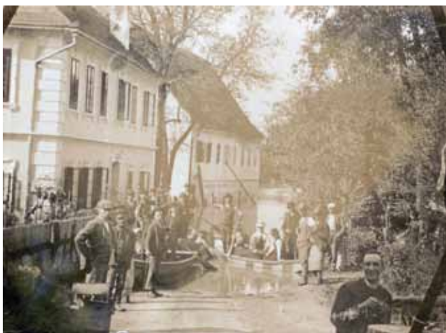
Foto: Hochwasser am 16.9.1899

Nach den ersten Gemeinderatswahlen mussten Bürgermeister und Gemeinderäte Erfahrung zur Führung der Gemeinden sammeln, was bestimmt nicht immer leicht war. Seit Auflösung des Stiftes 1784 waren die 4 Orte auch eigene Pfarren. Durch die unterschiedlichen Gegebenheiten