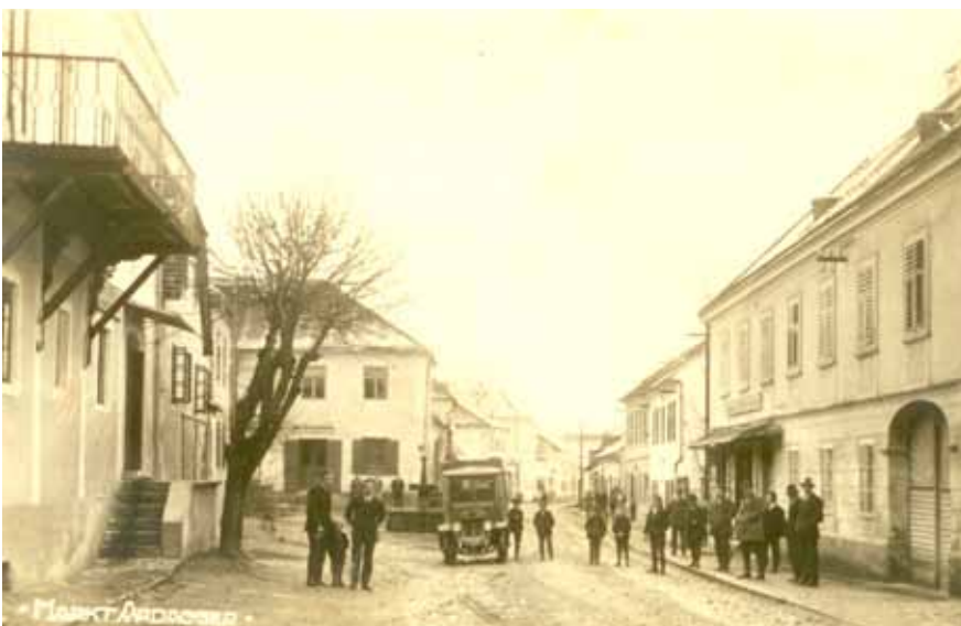
Foto der Marktstraße in Ardagger Markt aus den 1930er-Jahren.

Wir werden in Zukunft aber auch einige Funktionen in der gesamten Gemeinde zentral für alle anbieten und weiterentwickeln. Die neue Nahversorgung am Standort Mittelschule gehört dazu. Sie soll modern und attraktiv sein und ist deshalb nur gemeinsam wirtschaftlich machbar. Spätestens im Herbst 2024 soll sie am Standort bei der neuen Mittelschule fertig sein. Der gemeinsame Schulstandort ist das nächste große Vorhaben. Die Mittelschule und zusammengelegte Volksschule sollen ab Herbst 2025 rund 500 Schülerinnen und Schüler auch gemeinsam beherbergen, betreuen und ausbilden.