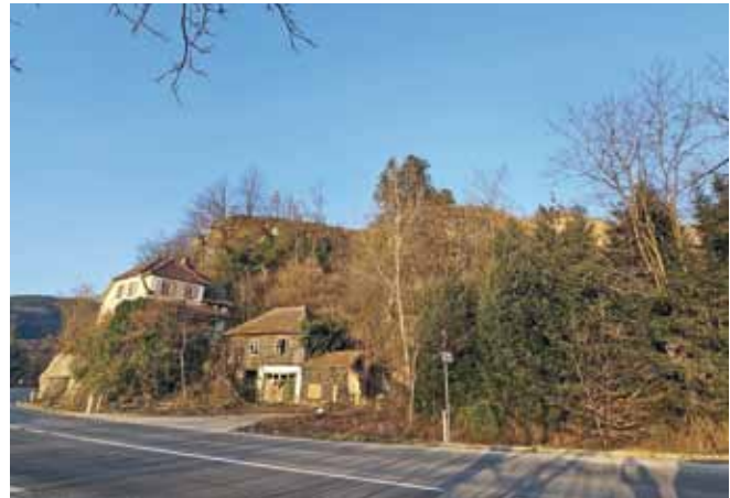
Abbildung 3: Felsporn „Saurüssel“ beim Odilia Steinbruch.

Donau hin vorspringende Felsporn (Abbildung 3) wurde in der Neuzeit – und ev. schon im Mittelalter – als Signalposten zur Donauschiffahrtsregulierung verwendet und könnte das Keramikfragment auf eine kleine Siedlung bzw. Befestigung vor Jahrtausenden hinweisen. Doch bleibt dies eine Hypothese bis zu einem späteren Zeitpunkt ev. archäologische Untersuchungen genaueres ans Tageslicht bringen können.