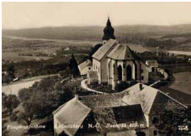
Diese Postkarte aus dem Jahr 1935 zeigt eine Flugaufnahme der Kirche Kollmitzberg.