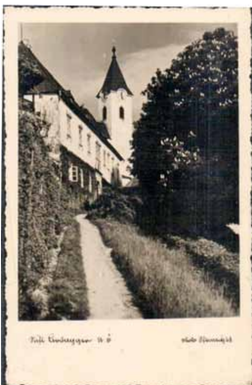
Das Stift Ardagger mit dem Schloss dargestellt auf einer Postkarte aus dem Jahr 1935.

Es gilt nun, den Blick auf die vierte Kirche in unserer Gemeinde zu richten. Die Stephansharter Kirche hoch