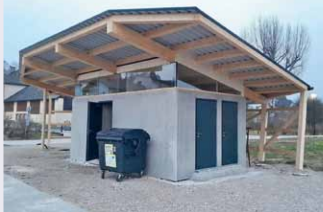
Foto: Das neue Infohaus im Donauwellenpark.

mit Überschusseinspeisung in Betrieb genommen. Das Infohaus war beim Halbmarathon am 1. April sogar schon funktionsfähig. So nimmt das neue "Häuschen" immer mehr "Form" an! Im Laufe des Frühjahrs folgt dann noch die Fertigstellung der Fassade, der Sitzmöbel, die Asphaltierung,...