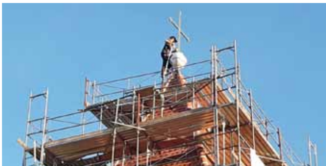
Foto v.l.n.r.: Das neue Turmkreuz der Pfarrkirche Ardagger Markt.

So wurde per Ende März die gesamte Aussensanierung der Pfarrkirche Ardagger Markt finalisiert. Weiter geht's im Herbst mit der Sanierung des Friedhofes und der Installierung eines barrierefreien Einganges. Herzlichen Dank an den Pfarrkirchenrat für die Hauptorganisation der gesamten Renovierung und allen, die mitgeholfen haben, sodass unsere Pfarrkirche als weithin sichtbares "Wahrzeichen" wieder wunderbar herausgeputzt wurde! Das neue Turmkreuz wurde bei der Budgetierung nicht im Projekt berücksichtigt, da die Schäden bei der Planung „von unten“ nicht gesehen wurden. Ziel ist jetzt, die Kosten von € 12.000,- über Spenden abzudecken. Die Kontodaten für diejenigen, die spenden möchten: IBAN AT45 3202 5000 0052 4694, Verwendungszweck: Kirchenrenovierung.