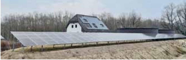
Foto: 84 kWp PV-Paneele wurden hochwasserreicher bei der Kläranlage installiert.