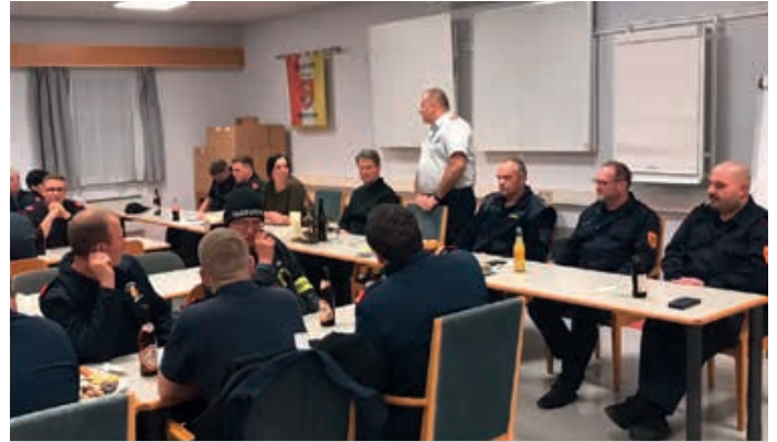
Die Kameraden der umliegenden Feuerwehren bei der „Zimtsternübung“

Am Mittwoch, dem 9. November fand in St. Georgen die letzte Funkübung, bei den Kameraden die sogenannte „Zimtstern Übung“, mit den Feuerwehren St. Georgen/Y., Krahof, Seisenegg, Viehdorf, Oberholz, Nabegg, Neustadt/Donau und Kollmitzberg statt. Wir bedanken uns für die zahlreiche Teilnahme und gute Kameradschaft der Nachbarwehren.