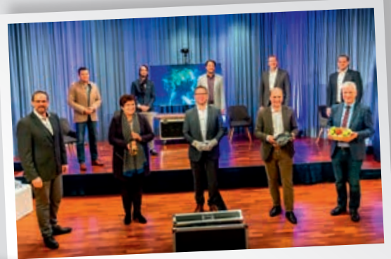
Gründung der Wirtschaftsraum Amstetten GmbH