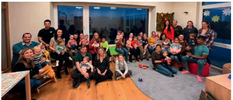
Insgesamt 14 Kleinkinder und deren Eltern nahmen am Babybesuchstag des Jahrgangs 2021 teil.

Organisiert durch GR. Gerlinde Jochinger und GR. Karin Kaltenbrunner, als Projekt des „Arbeitskreis Soziales“, konnte der Babybesuchstag wieder im Zwergennest abgehalten werden.