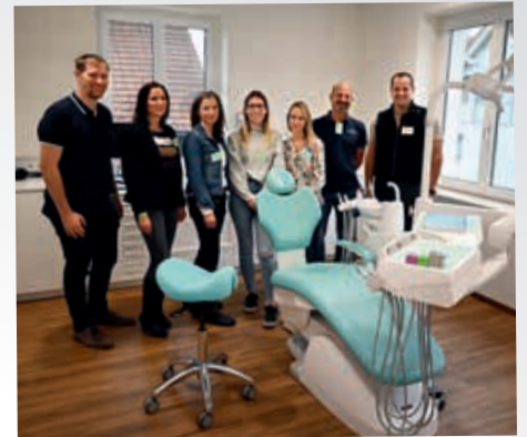
Sicherstellung der Gesundheitsversorgung