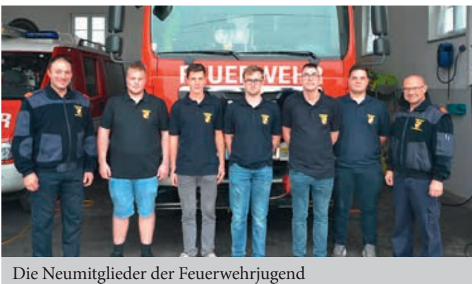
Die Neumitglieder der Feuerwehrjugend