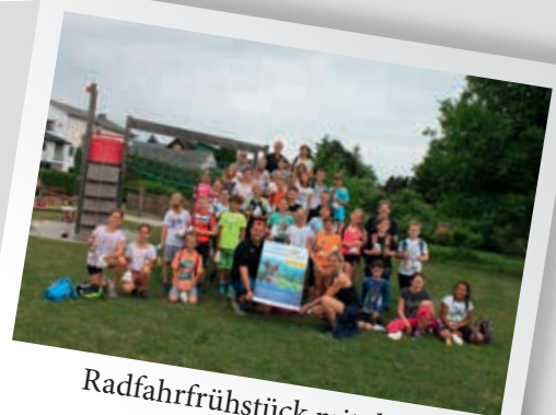
Radfahrfrühstück mit dem Bürgermeister