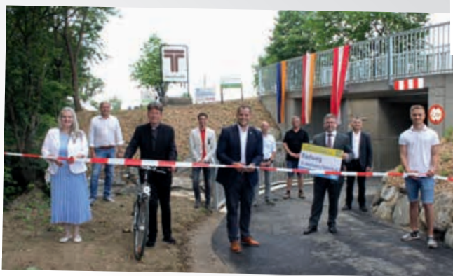
Eröffnung der neuen Postbrücke