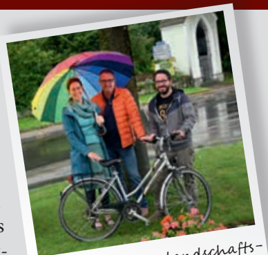
Kultur & Naturlandschaftsvermittlung

Genießen Sie, liebe Bürgerinnen und Bürger, auf den folgenden Seiten einen kleinen Streifzug durch die Projekte und Themen, welche mich als Bürgermeister der Marktgemeinde St. Georgen/Y. seit 2020 begleitet haben!