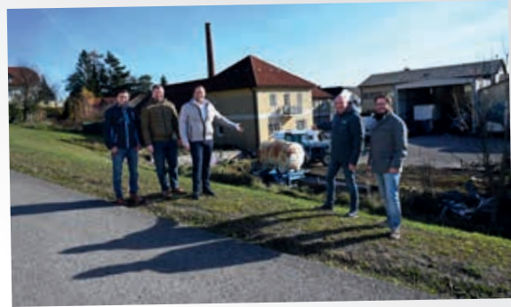
Kauf des Molkereigrundstücks