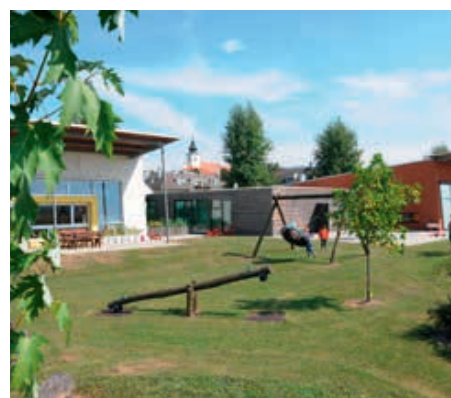
Die Kindergarteneinschreibung erfolgt durch eine Online Anmeldung.

Bei diesem ersten Kennenlernen können offene Fragen vor Ort geklärt werden. Die ausgefüllten Formulare werden gemeinsam durchgegangen und gegebenenfalls ergänzt. Zudem werden die benötigten Unterschriften zur Anmeldung eingeholt und Infos zum Kindergartenalltag erläutert. Sie werden gebeten, die Geburtsurkunde und den Impfpass des Kindes bei diesem Termin mitzunehmen.