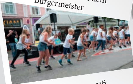
100 Jahre NÖ