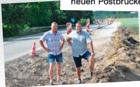
Rad & Begleitwegebau