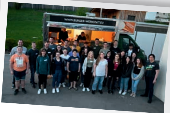
“Unsere Jugend - unsere Zukunft”