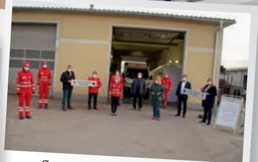
Corona Teststraße in Hart