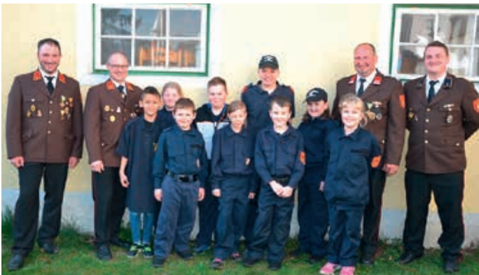
Der Feuerwehrynachwuchs der Freiwilligen Feuerwehr Krahof

Über das gesamte Jahr hinweg gab es bei der FF Krahof immer wieder erfreuliche Momente. So konnten wir bei der jährlichen Mitgliederversammlung jene Kinder und Jugendlichen begrüßen die sich der Kinderfeuerwehr bzw. Feuerwehrjugend angeschlossen haben. Ebenso haben sich erfreulicherweise fünf junge Männer dazu entschlossen der FF Krahof beizutreten. Ich wünsche allen Neumitgliedern viel Freude und Erfolg im Feuerwehrdienst.