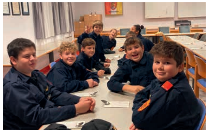
Auch die Feuerwehrjugend nahm bei der jährlichen Inspizierung teil.