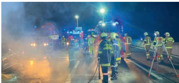
Einsatz auf der A1