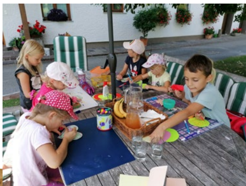
Spiel & Spaß mit Pony Brösel am 21.+23. Juli 2022