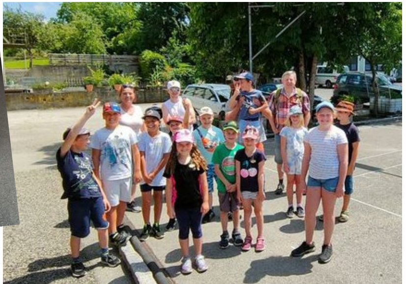
Kleiner Ball - großer Spaß am 21. Juli 2022