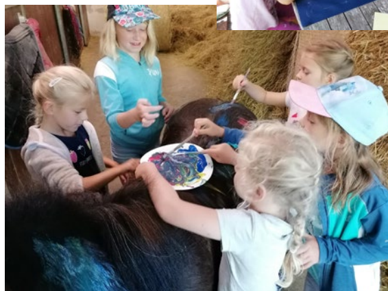
Nachmittag am Bauernhof am 5. August 2022