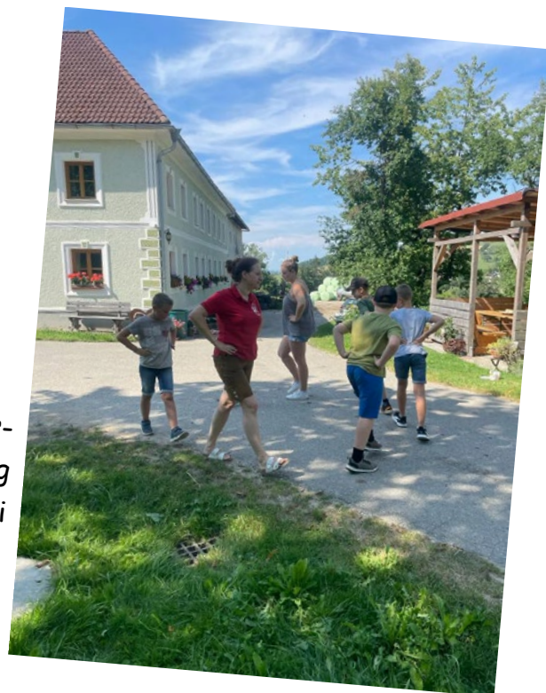
Plattler-Nachmittag am 29. Juli