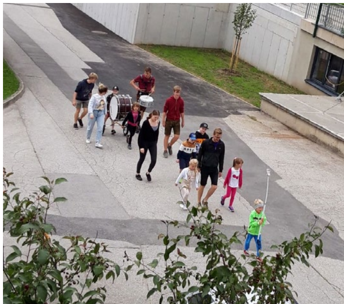
Musikalischer Nachmittag am 8. Juli 2022