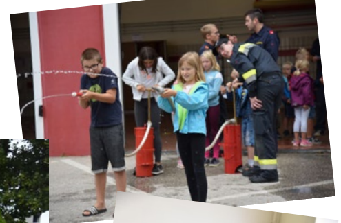
Spaß mit der Feuerwehr am 20. August 2022