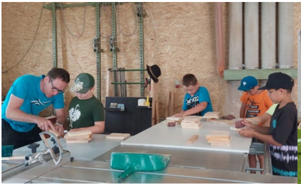
Bau eines Nistkastens am 15. Juli 2022