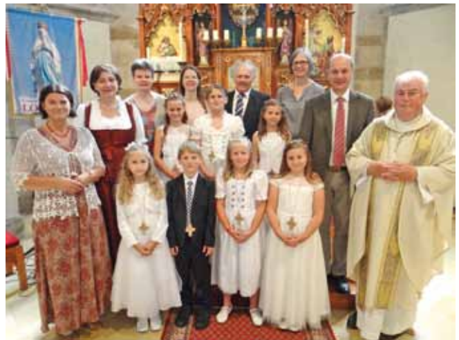
Foto: In Kollmitzberg fand die Erstkommunion am 26. Juni statt und 7 Kinder waren mit dabei.