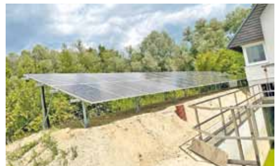
Foto: Ein Teil der PV-Anlage, welche bei der Kläranlage Ardagger zusätzlich installiert wurde.

rund 87 KWp leisten. Rund 20 % dieses Stromes kann direkt auf der Kläranlage verbraucht werden und muss nicht zugekauft werden. Weiters wird zusätzlich ein Speicher mit einem Volumen von 100 KW ergänzt. Mit der Zwischenspeicherung können dann insgesamt 60 % des Stromes genutzt werden. Dies einfach durch Ausgleich von Bedarfen während des Tages und auch als Speicher, um die Anlagenleistungen während der Nacht teilweise abdecken zu können. Damit würde nur mehr 40 % ins Netz als Überschussstrom einspeist werden. Die Amortisation der PV-Anlage allein sollte damit unter Abzug der Förderungen bereits bei nur mehr 7 Jahren liegen, während die Lebensdauer bei 25 bis 30 Jahren ausmacht. Die Amortisation der PV-Anlage inkl. des Speichers – also die Gesamtamortisation