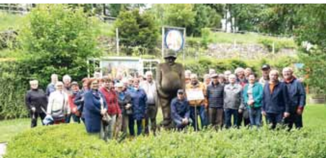
Foto: Die Senioren des Seniorenbundes Stephanshart beim Ausflug nach Lichtenau.

dienst zu Ehren der Mütter und Väter, der von den Senioren mitgestaltet wurde. Nach dem Mittagessen gab es eine interessante Führung durch den Karikaturengarten, den Eisenkeller und das Bauernmuseum in Brunn am Walde. Der gemütliche Ausklang fand im Spitzer Graben beim Heurigen statt.