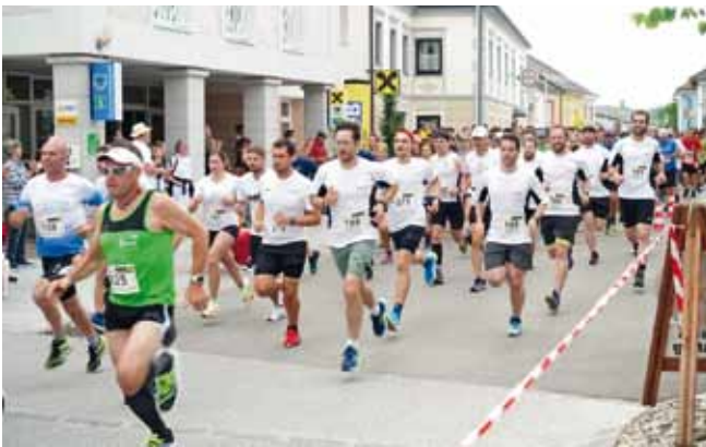
Foto v.l.n.r.: Für einen guten Zweck waren 300 Läuferinnen und Läufer beim Businessrun zu Gast.

building untereinander stand aber auch der gute Zweck einmal mehr im Mittelpunkt. Bis spät in die Nacht hinein wurde der Lauf noch nachgefeiert. Herzlichen Dank an das Team von Burgi Brandstetter im ULC Ardagger. Da hat wieder einmal alles, inkl. dem Wetter, perfekt gepasst!