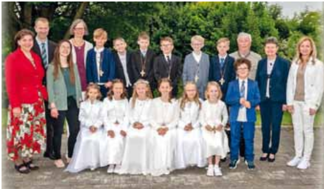
Foto: In Stephanshart feierten am 29. Mai 13 Kinder ihre Erstkommunion.