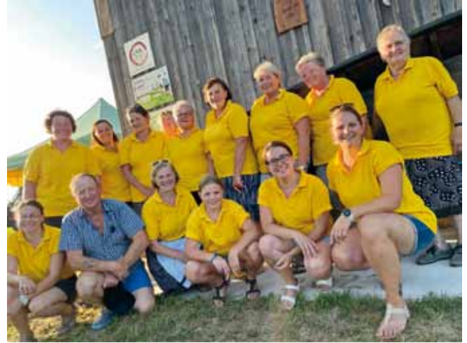
Foto: Die Helferinnen und Helfer beim „Z'sammsitz'n beim Ruthner Stadl“ in der Au.