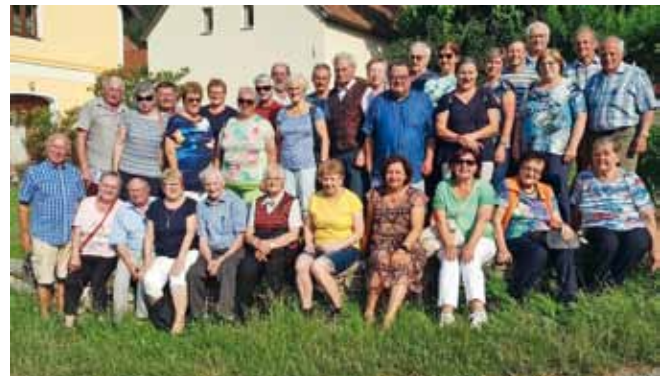
Die Senioren des Seniorenbundes Kollmitzberg beim Ausflug in die Wachau.