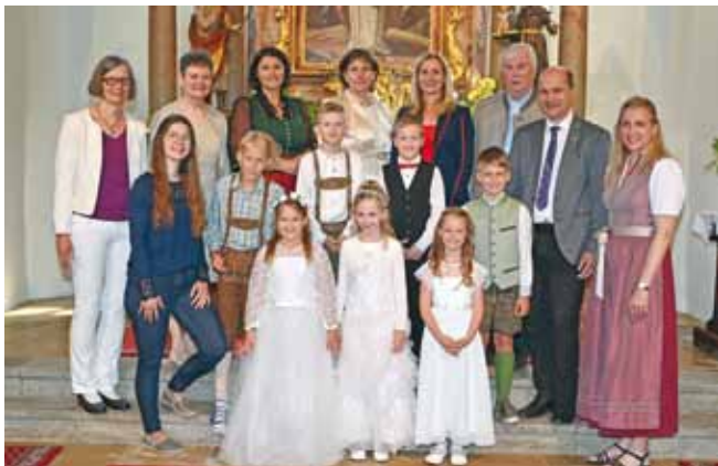
Foto: Am 19. Juni fand die Erstkommunion in Ardagger Markt statt. 7 Kinder waren erstmals am Altar.