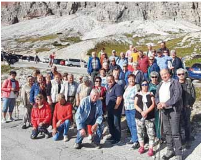
Foto: Die Senioren aus Ardagger Markt und Kollnitzberg beim Ausflug nach Südtirol.

(Pordoio, Sella usw.) standen am Programm. Außerdem führte die Fahrt nach Kastelruth, Fassatal und den Gardasee, sowie ins Arntal zur Schnitzerwerkstatt „Marannatha“. Vielen Dank an Alle, die hier mitorganisiert haben für den wunderbaren Ausflug.