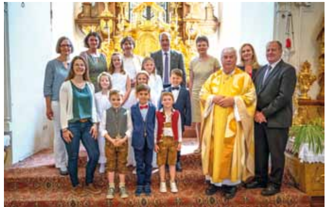
Foto: 8 Kinder waren am 19. Juni in Ardagger Stift das erste Mal bei der heiligen Kommunion.