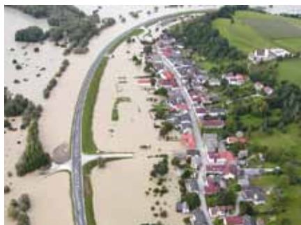
Foto: Besonders betroffen vom Hochwasser 2002 waren die Häuser in Ardagger Markt

Vor 20 Jahren hat uns auch in Ardagger eine Jahrhundertflut getroffen. Am 12.8.2002 war den Einsatzkräften endgültig klar, dass damals ein Jahrhunderthochwasser auf dem Weg war. Am 14.8.2002 hatte die Donau ihren Höchststand erreicht und noch einmal dramatisch wurde es am Vormittag des 14.8.2002 als wegen eines Abrutschens der Damminnenböschung nochmals im behördlichen Auftrag hinter dem Damm geflutet werden musste.