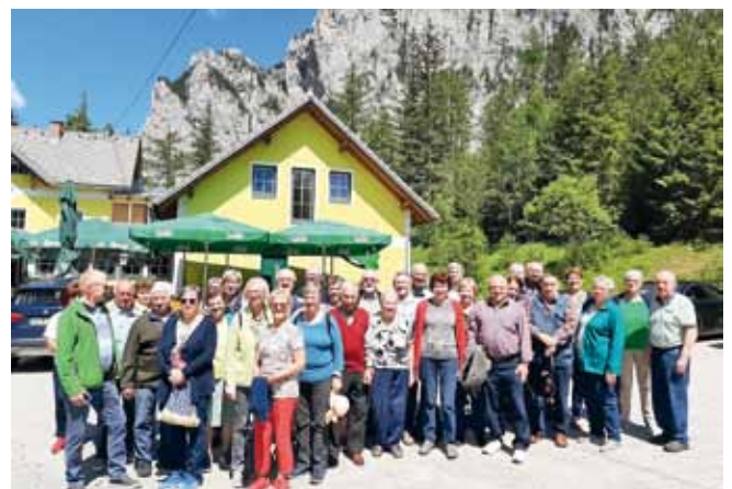
Foto: Für eine große Gruppe der Senioren aus Ardagger Stift ging es zwei Tage in die Steiermark.

war eine große Gruppe mit dabei und verbrachte einige wunderbare gemeinsame Tage! . Danke an das Organisationsteam für die Ausrichtung des tollen Ausflugs.