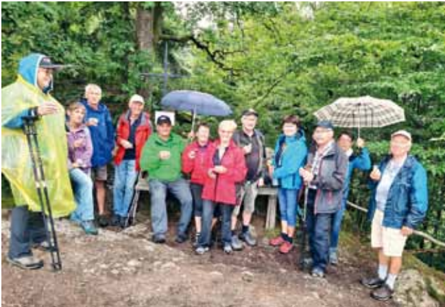
Foto: Trotz Schlechtwetters ging's bei der 55+-Wanderung zum Marienstein im benachbarten Grein.

Aus allen 4 Katastralgemeinden waren Wanderer mit dabei. Vielen Dank an alle, die hier einerseits organisiert haben und andererseits aber auch dem Regen getrotzt haben.