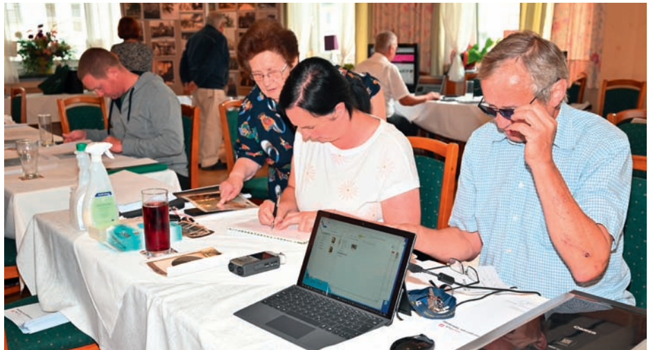
Zahlreiche Bilder wurden vor Ort eingescannt und in das digitale Archiv aufgenommen