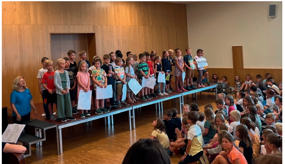
Voller Stolz präsentierten die Kinder ihre gemeinsam einstudierten Lieder und Tänze.

Ein großes Dankeschön gilt den LehrerInnen, welche unseren Kindern das ganze Schuljahr über mit vollem Engagement das notwendige Wissen für ihre Zukunft vermitteln.