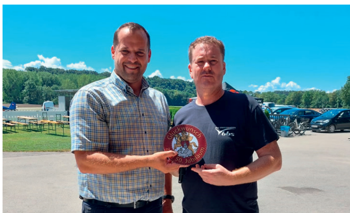
50 Jahre Union Sportfliegergruppe Ybbs

nun auch auf eine Vereinszeit von über 60 Jahren zurückblicken darf. Die Marktgemeinde St. Georgen am Ybbsfelde möchte auf diesem Wege nochmals recht herzlich gratulieren und wünscht für die weitere Zukunft alles Gute!