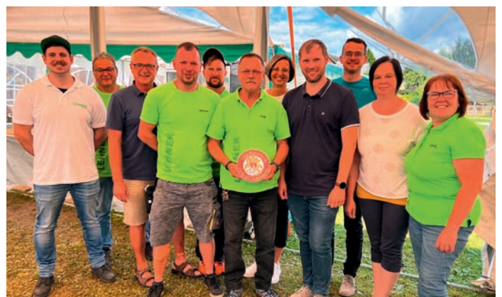
60 jähriges Jubiläum der ESV Ybbsfelder Eiskönige