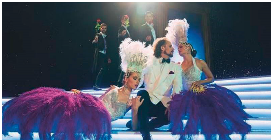
Tag der Kleinregion - Ermäßigung für die Abendvorstellung „Der Graf von Luxemburg“ am 15. Oktober in der Ybbsfeldhalle Blindenmarkt

Die Bestellung der ermäßigten Karten ist für die oben genannte Vorstellung über das Gemeindeamt in St. Georgen/Y. möglich: 07473/2312