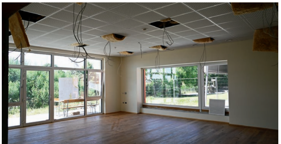
Hier ist einer der beiden Gruppen-Räume zu sehen, in dem ab September die Betreuung der Kleinkinder stattfinden wird.

Desweiteren soll bis zur Betriebsaufnahme im September die Neugestaltung des Gartenbereichs vorgenommen werden.