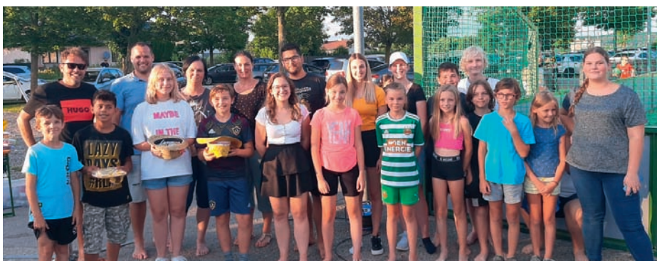
Einen gemütlichen Grillabend verbrachten die St. Georgner Jugendlichen am Fun Court.

Zahlreiche Jugendliche fanden sich kürzlich zu einem gemütlichen „Grill and Chill“- Abend beim Fun Court in St. Georgen zusammen, um gemeinsam zu Würstchen zu grillen, Musik zu hören, und ein Volleyball Match „alt gegen jung“ zu spielen. Als besonderer Leckerbissen stellte sich die rein pflanzliche „Vegini Bratwurst“ heraus, welche direkt vom ortsansässigen Produzenten Veggie-Meat stammt.