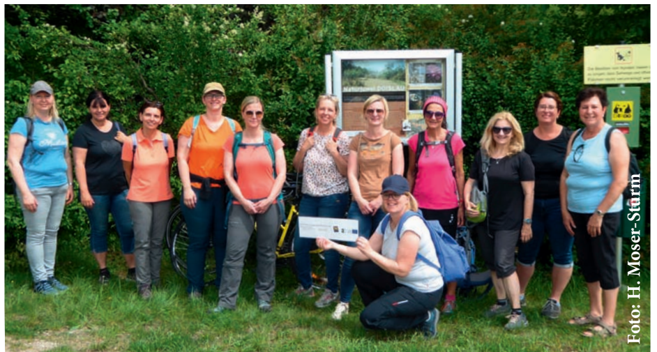
Die Pädagoginnen bildeten sich in und über die Doislau weiter.

Begeisterung schafft Nachhaltigkeit Der fachliche und methodische Input, den die Pädagoginnen beim Weiterbildungstag bekamen, soll es ihnen erleichtern, mit ihren Schulklassen die Besonderheiten der regionalen Kultur- und Naturlandschaft zu entdecken. „Für die Zukunft unserer Region und das erforderliche Umweltbewusstsein unserer Jugend ist das enorm wichtig“, betont Moststraße-Geschäftsführerin