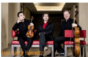
Altenberg Trio Wien