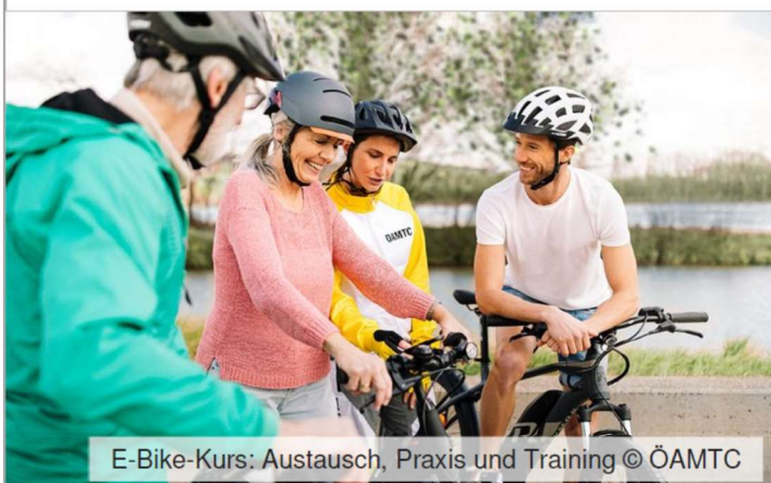
E-Bike-Kurs: Austausch, Praxis und Training

30. Juni 2022, 13:30-16:30 Uhr, Parkplatz Ausee 2