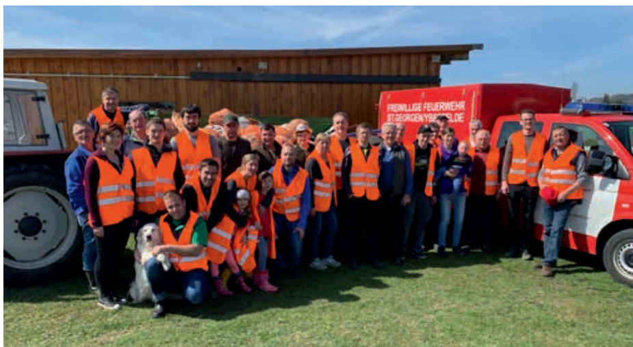
In diesem Jahr kann der Frühjahrsputz wieder wie üblich abgehalten werden.

Bei der gemeinsamen Aktion sammeln wir den Abfall, der sich in der Natur, insbesondere neben Straßen und Wegen, angesammelt hat, ein. Auch in diesem Jahr sind wieder zahlreiche Vereine und Organisationen an der Aktion beteiligt: wie die FF St. Georgen/Y., die JVP Krahof, der Wanderverein und die St. Georgner Jägerschaft. Leisten auch Sie einen wichtigen Beitrag für unsere Umwelt und