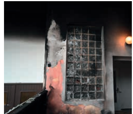
Die Brandermittler vermuten eine fremde Zündquelle als Brandursache.

Auch das „Dahoam-Cafe“, welches zu diesem Zeitpunkt noch im Gebäude eingemietet war, blieb durch den raschen Einsatz verschont. Dieses hat seine Pforten im Jänner geschlossen