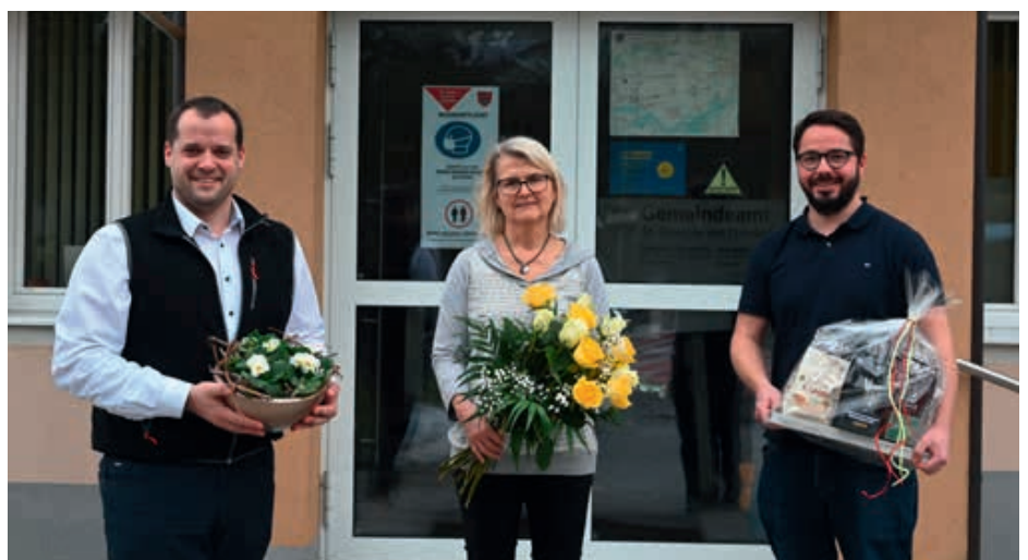
Wir wünschen ihr alles Gute für die Pension, viel Spaß bei ihren zahlreichen Hobbies und viele schöne Stunden gemeinsam mit ihrer Familie!

Die Marktgemeinde St. Georgen am Ybbsfelde dankt an dieser Stelle nochmals für ihr langjähriges Engagement, ihren Einsatz für die Anliegen der St. Georgner und St. Georgnerinnen und für ihren freundlichen und zuvorkommenden Umgang mit allen Gemeindebürgerinnen und Bürgern.