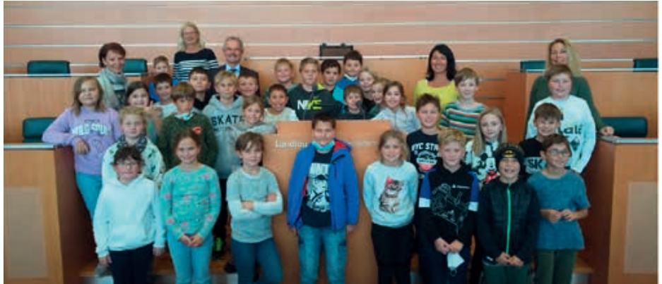
Die Schüler der 4. Klassen VS wurden persönlich vom Landtagspräsidenten Karl Wilfing im Landhaus empfangen.

Ihr Weg führte sie durch die Altstadt und weiter ins Regierungsviertel, wo die Schüler das Wahrzeichen Niederösterreichs, den Klangturm, besichtigen konnten. Beim anschließenden Besuch im Landhaus, hatten die Schüler die besondere Ehre, vom Landtagspräsidenten Karl Wilfing persönlich empfangen zu werden und auf Einladung der Landeshauptfrau im Landhaus essen zu gehen.