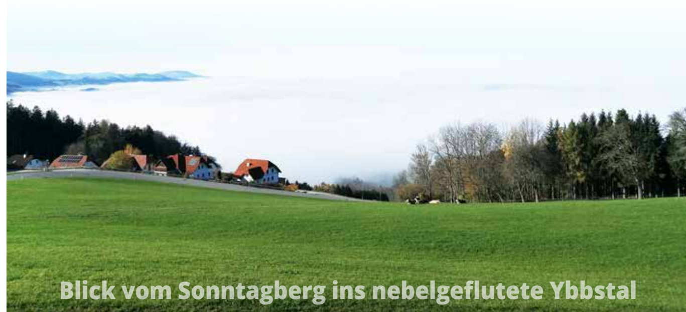
Blick vom Sonntagberg ins nebelgeflutete Ybbstal

Bei Interesse finden sie mehr Informationen auf www.dahome.at